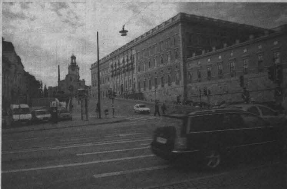
Резиденция короля Швеции.

Комплекс зданий гимназии располагается на окраине города, в сосновом лесу. Здесь учатся не только шведы, но и представители США, Канады, Франции, Венгрии. Обучение бесплатное. Чтобы дать образование ребенку в гимназии,