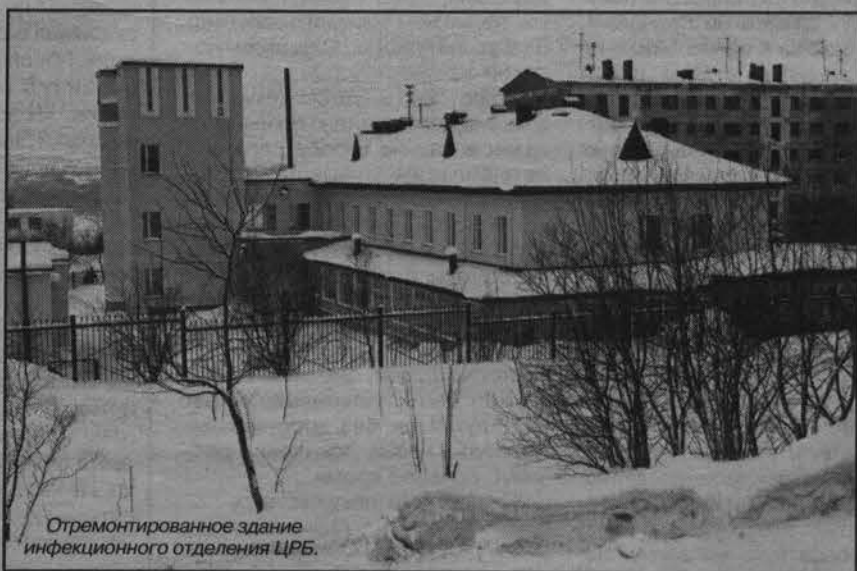
Отремонтированное здание инфекционного отделения ЦРБ.