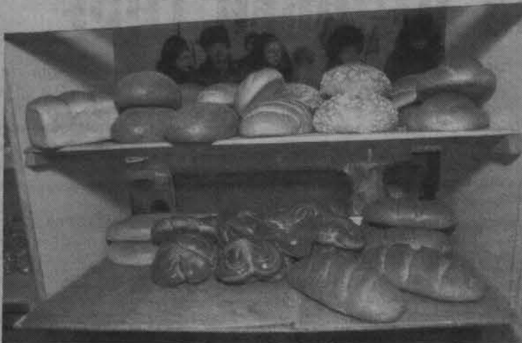
Мы выбираем, нас выбирают... Знать бы только кто и что.

На каждой упакованной продукции имеется заводская мар-