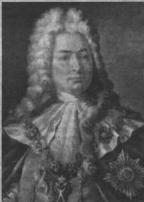
Павел Иванович Ягужинский занимал пост генерал-прокурора России в 1722-1736гг.

суального законодательства началась в середине XIX века. С этого времени стали интенсивно готовить судебные уставы. Деятельность прокуроров поделили на законоохранительную и обвинительную.