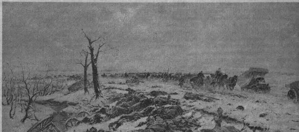
Февраль 1942 года: авантюрное наступление на харьковском направлении, которое в мае обернется окружением нескольких советских армий, гибелью и пленением большого числа наших солдат.

Среди добровольцев из числа бывших советских граждан, служивших в годы войны в немецкой армии, были как ярые противники советской власти, так и сдавшиеся в плен от безысходности положения. Но всех без исключения ожидала одинаковая судьба: арест, допросы, исправительные лагеря.