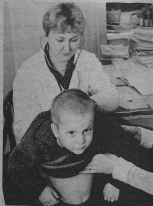
Скоро и росляковские ребята будут получать медицинскую помощь в своей детской поликлинике.

Записала Галина ЛЫСЕНКО.