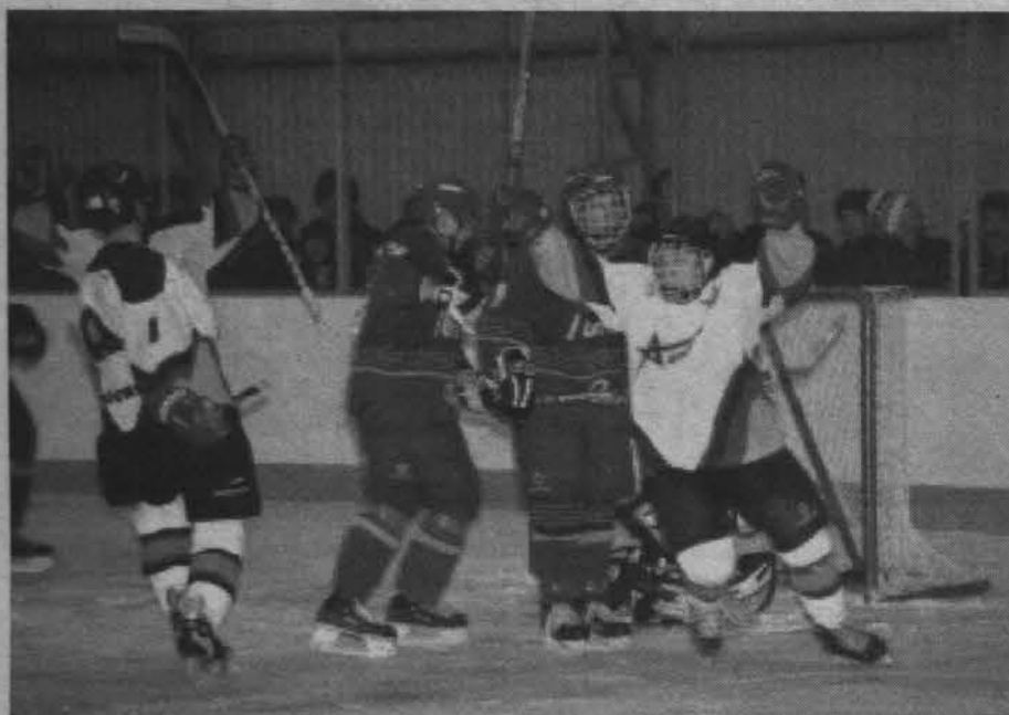
Это гол, ребята!