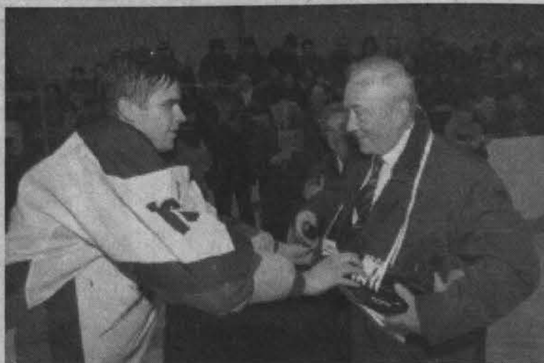
В хоккей играют настоящие мужчины.