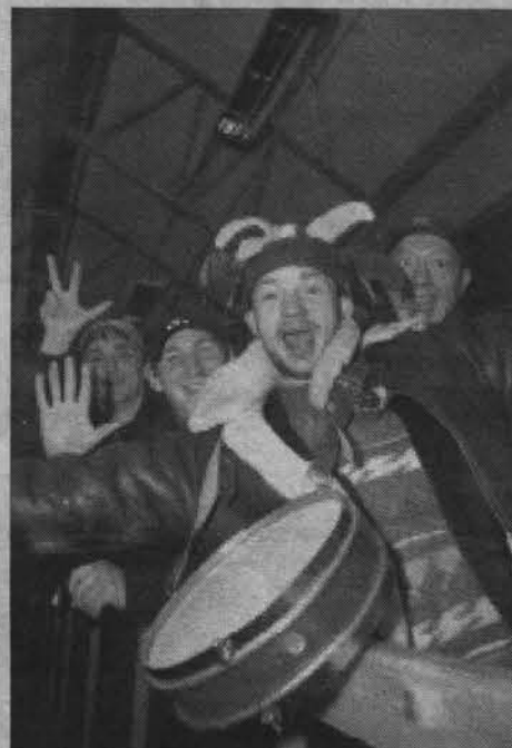
Это не болельщики, это фанаты!