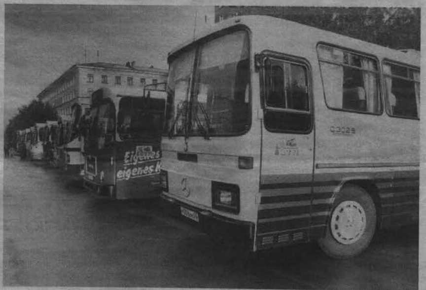
Октябрь 1997 года. В Североморск пришли 11 автобусов известных немецких фирм «Мерседес-Бенц» и «МАН».

Еще одна проблема заключается в том, что предприятие не полностью профинансировано из бюджета ЗАТО. Но она носит, видимо, временный характер и в данный момент решается положительно. Если она не будет