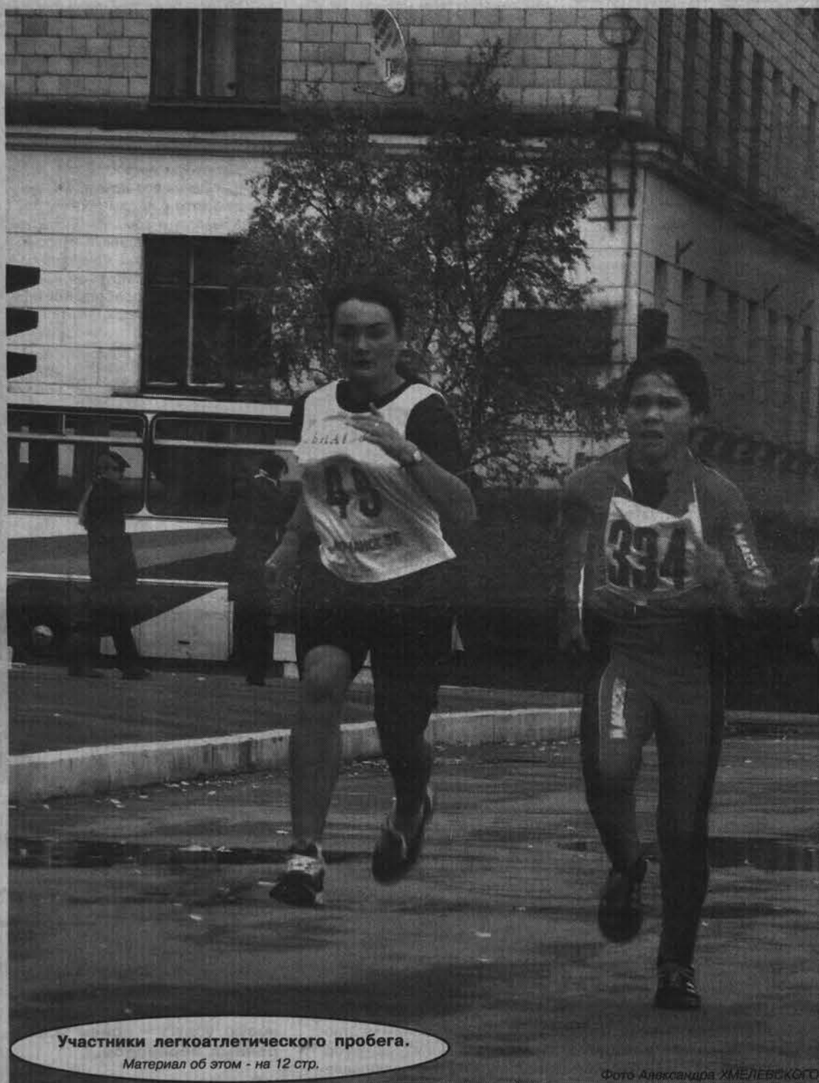
Участники легкоатлетического пробега.