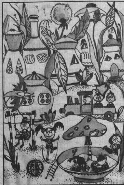
Юлия Утва, 12 лет. «Ах, я мечтаю жить в траве» (тушь, кисть).

- Произошли какие-нибудь неожиданные для вас открытия?