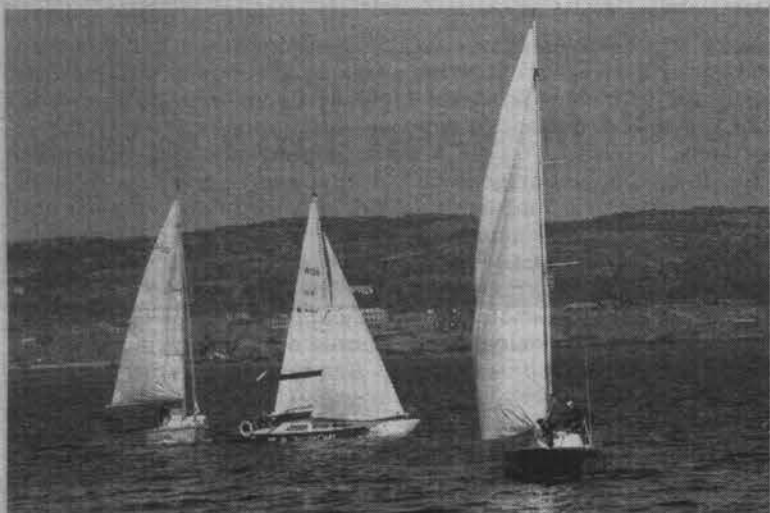
Выбор позиции на стартовой линии.

P. S. Торжественное закрытие регаты состоится на причале №1 19 июля в 15.00.