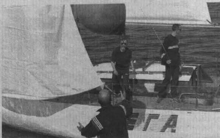
«Вега» готовится к первому рейсу.