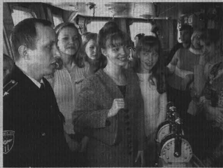
Знакомство с кораблем.

Бытует устойчивое мнение, что особенно заразительны дурные привычки. Но, глядя, с каким энтузиазмом делают свое по-настоящему благородное дело молодые таланты, поневоле заражаешься их задором и оптимизмом. Может, именно поэтому они давно уже не только