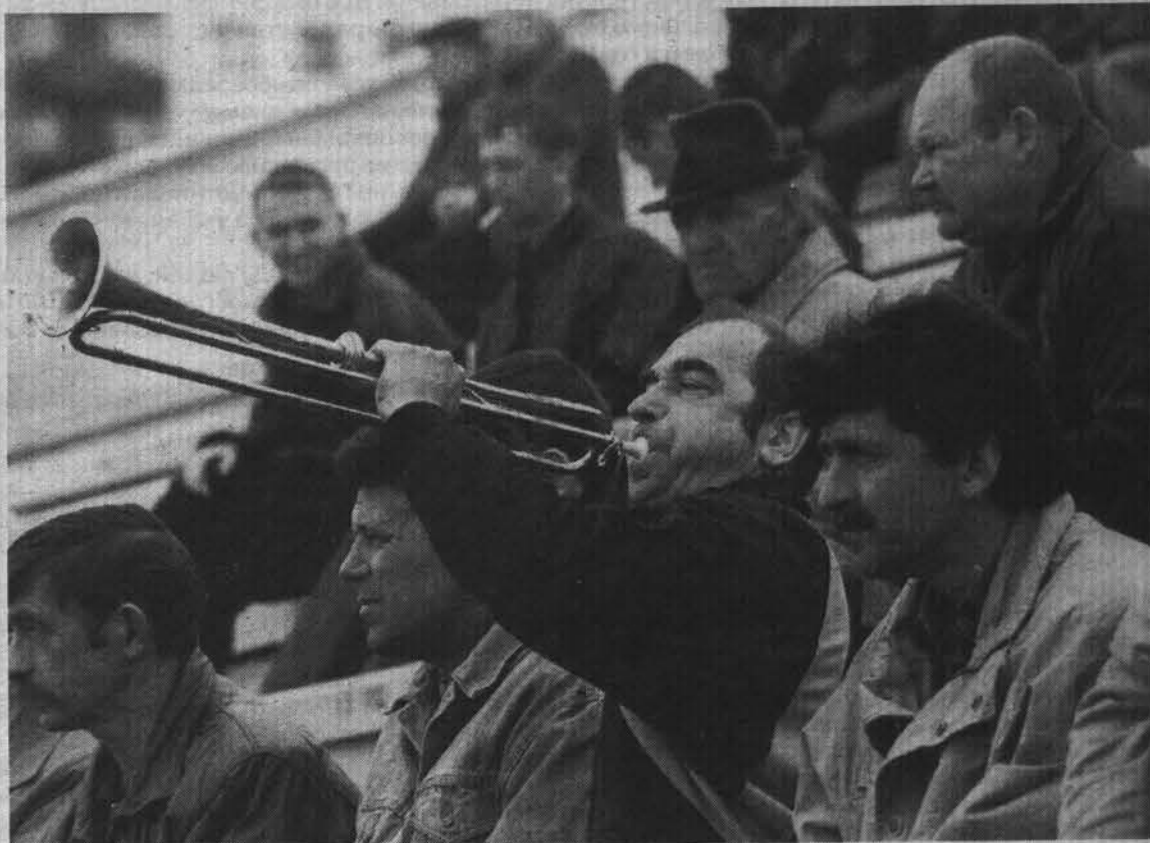
Североморские болельщики ждут от своей команды только побед.