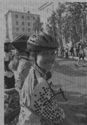
Полосу подготовил Эдуард ПИГАРЕВ.