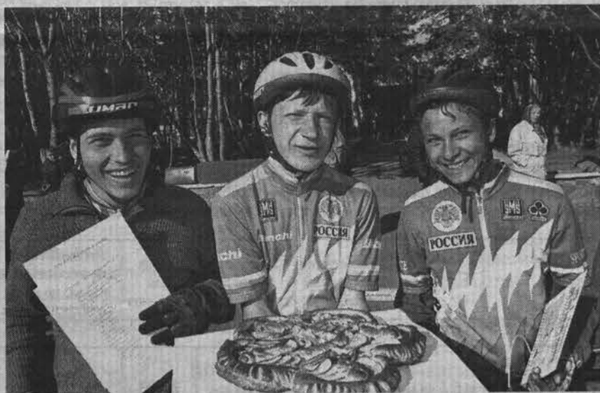
Яблочный пирог за мужество и упорство.