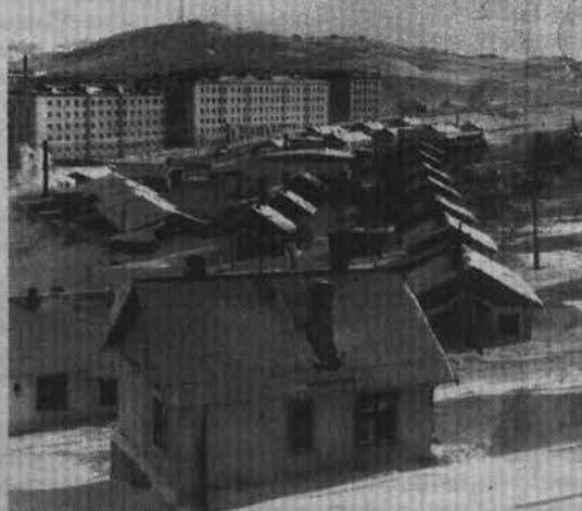
Вид с улицы Душенова на Маячную сопку.