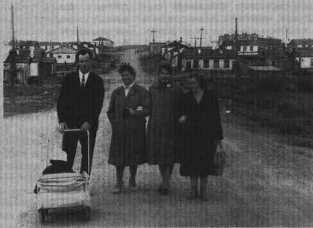
Семейная прогулка по улице Душенова.