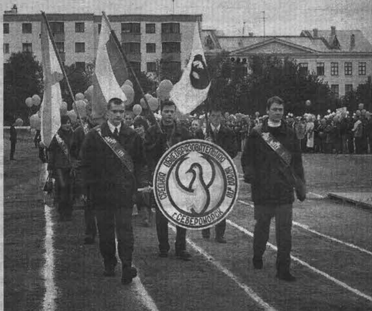
Парад выпускников школ.