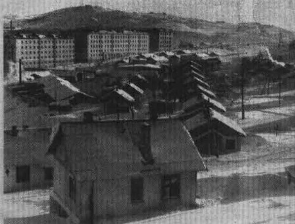
Вид с улицы Душенова на Маячную сопку.