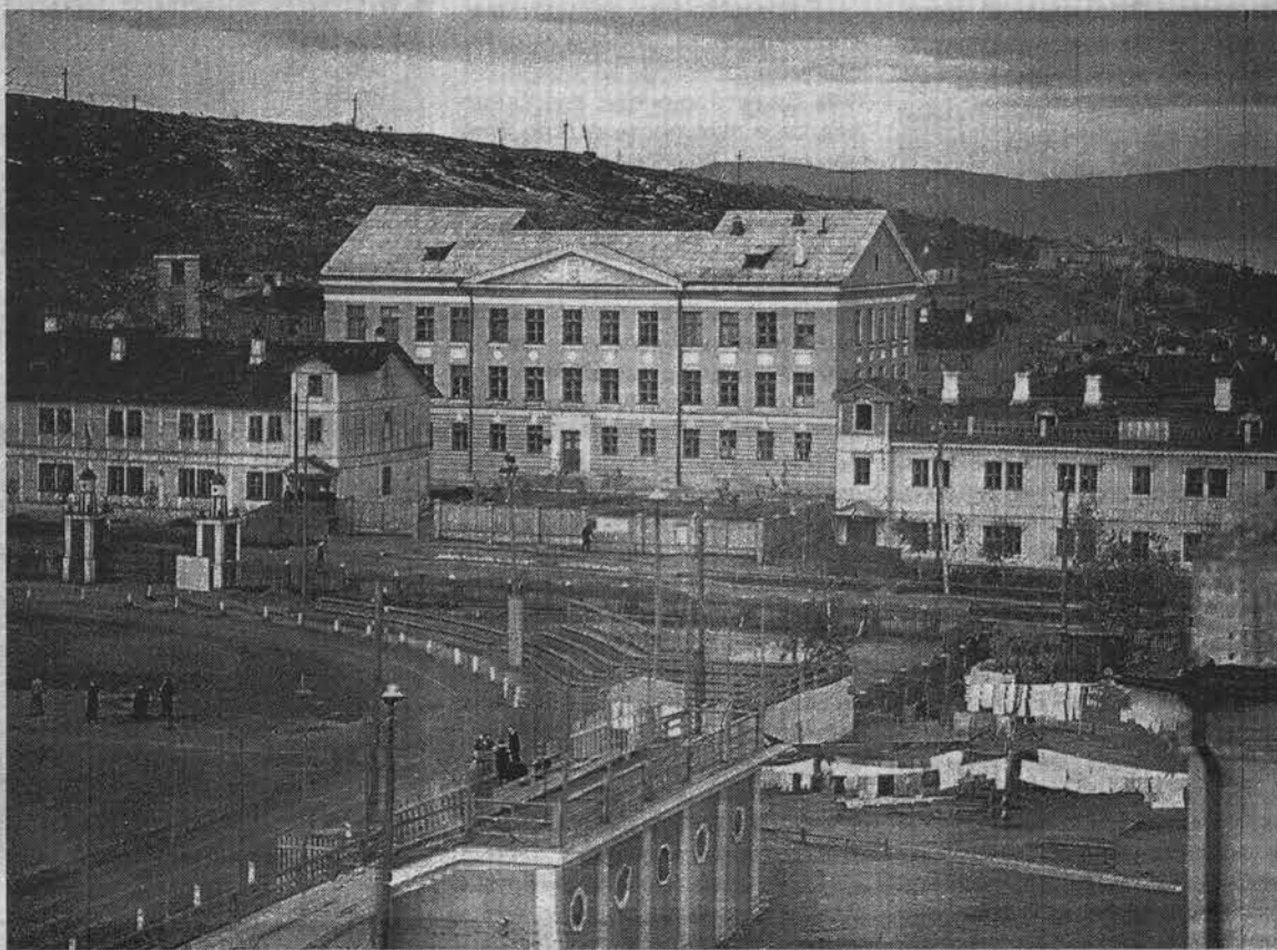
Вид на Дом пионеров со стадиона.