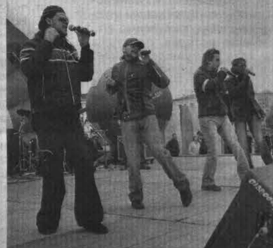
Выступление группы «Премьер-министр».