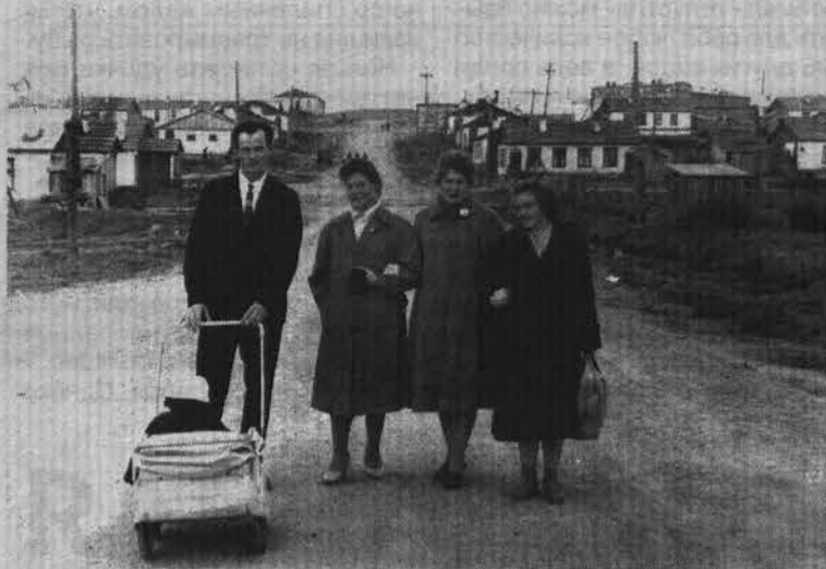
Семейная прогулка по улице Душенова.

чтобы что-то осталось от моей работы, от нашего общего труда. Наша фирма практически первая записала аудиокассеты с песнями о Севере.