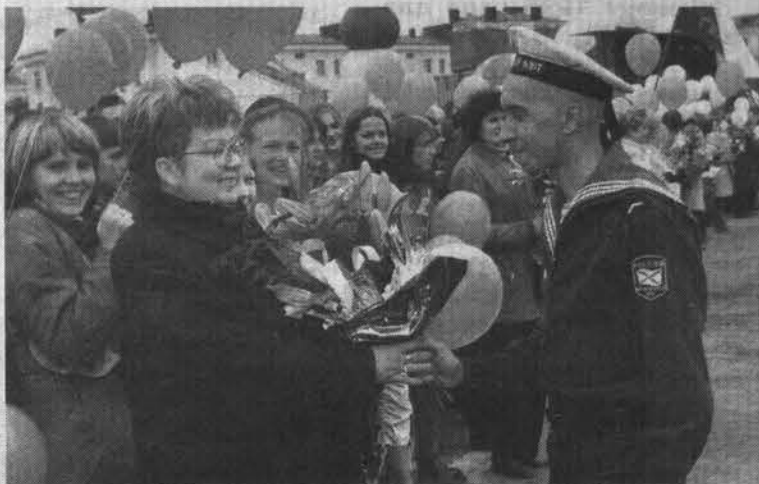
Вручение учителям букетов за высокое мастерство.

Но это были сопутствующие декорации, как буфет в театральном фойе, основное действие сосредоточилось в центре футбольного поля. Там была возведена сценическая площадка с надувной аркой, посреди которой возвышалась больших размеров цифра пять - именно столько раз отмечается этот праздник и именно такую оценку выставила городская администрация североморским учителям за прекрасную работу в минувшем учебном году, что, ес-