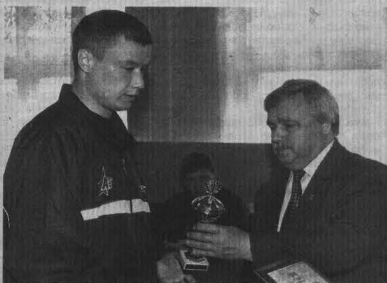
Награда спортсмену из рук мэра.

Правда, сама встреча прошла несколько грустно, что объяснялось исключительно недавним поражением от «Ротора-УГПС», вызвавшим волну серьезной критики и напряженным графиком игр нынешнего сезона. Как было замечено тренером Алек-