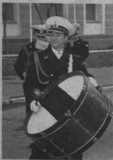
Какой оркестр без барабана?

В минувшее воскресенье Северный флот праздновал семидесятилетие со дня своего образования. В этот день «официальные» торжества начались в 9.00 на борту большого противолодочного корабля «Адмирал Чабаненко».