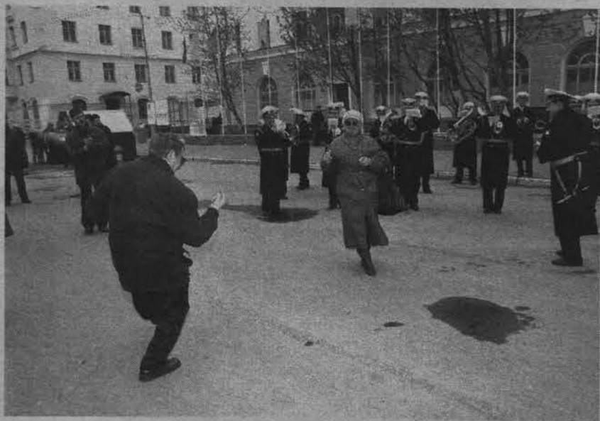
Официальная часть позади. Гуляй, народ!

Александр ПАНОУШКИН.