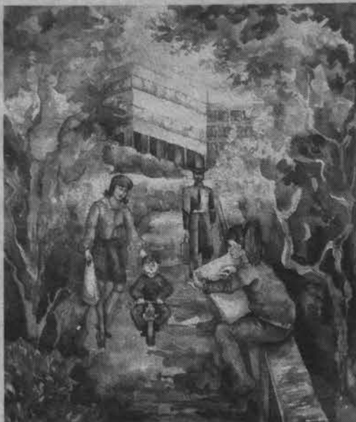
А. Сапрыкина «Североморский пленэр».