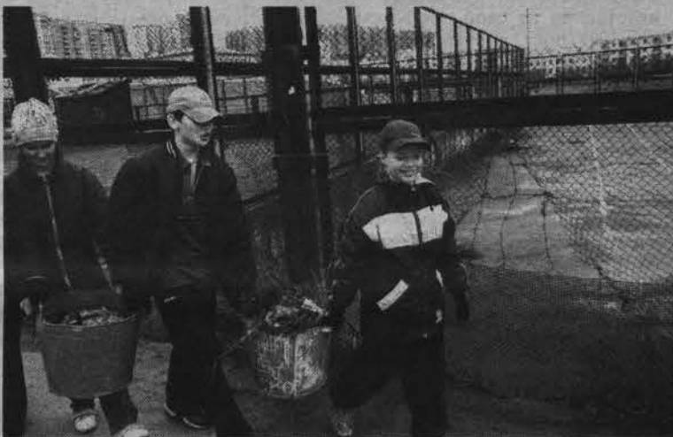
Возле школы №10 не осталось ни бумажки.

Может быть, издадим закон, запрещающий бросать мусор мимо урны, создадим из желающих молодежи отряд «неравнодушных»? Ребята будут ходить по городскому парку, детскому городку, по площадям и другим излюбленным местам североморцев и смотреть за порядком и чистотой. С нарушителей будут брать штраф. К примеру, за брошенную бутылку - 50 рублей, за окурки - 30, за фантик - 10. А если недосмотрят