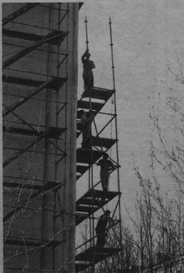
Сафонова, 20. Скоро дом засияет свежими красками.

если человек малоимущий - инвалид, ветеран, одиноко проживающий пенсионер - и оборудование пришло в негодность, а денег на его замену нет, что делать? Принято решение каждое обращение рассматривать индивидуально, и, если необходимо, менять за счет города. По обращениям жильцов составлена программа, и на замену сантехоборудования выделено 2 миллиона рублей.