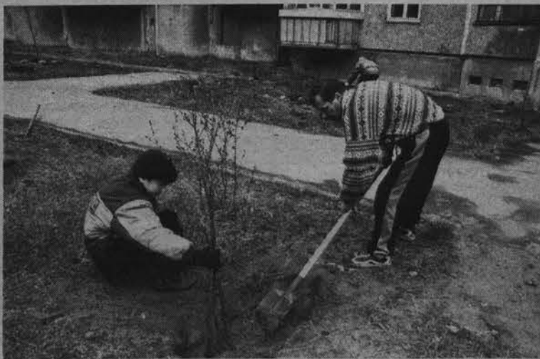
На улице Падорина жители не только убрали мусор, но и посадили саженцы.