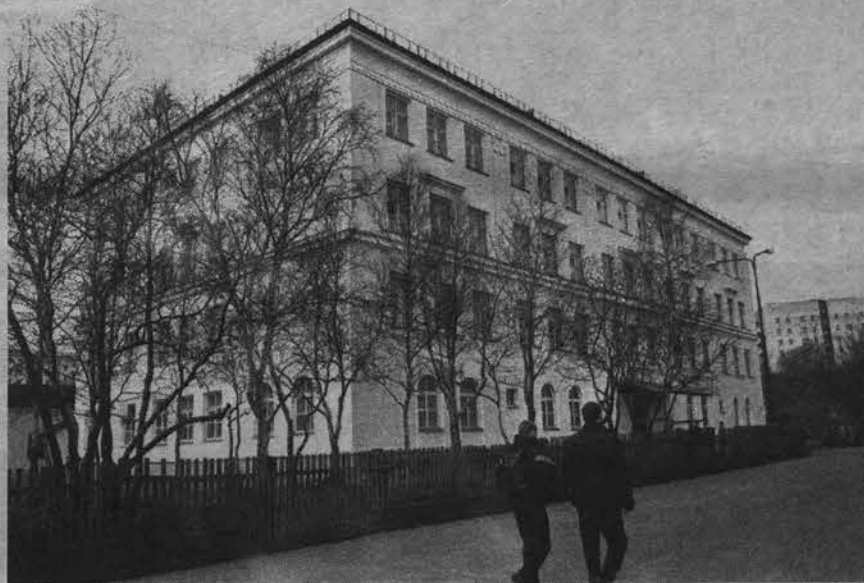
Пока еще двери «десятки» открыты для своих учеников.

Школе требуется капитальный ремонт, но детям и родителям «десятки» хочется жить, учиться с уверенностью в завтрашнем дне. Мы надеемся и верим, что ремонт школы пройдет с минимальными потерями для школьного коллектива, так как этими вопросами занимаются компетентные организации.