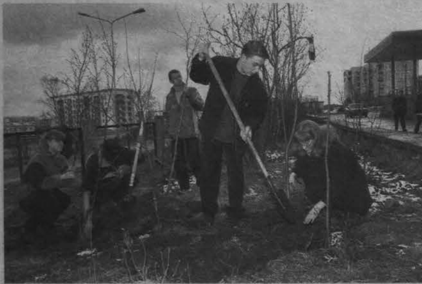
В прошлом году учащиеся СШ №7 высадили во дворе своей школы 50 деревьев.