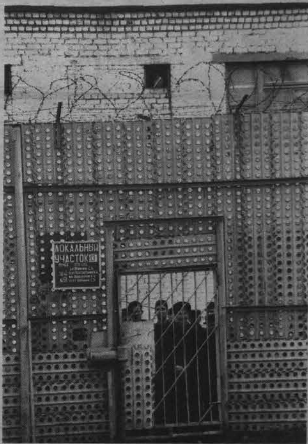
ящему все осознают. Только бы не было поздно.

На обратном пути школьники как-то чересчур оживились, стали вести себя раскованно, несдержанно, не стесняясь взрослых. Неужели поездка подействовала на них не так, как ожидали взрослые? Может, они так и не поняли, где побывали? Возможно потом, когда-нибудь, эти дети по-насто-