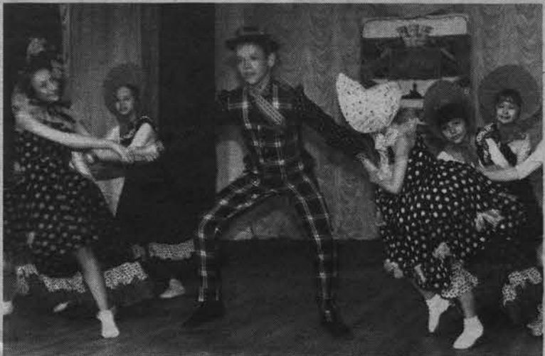
Хореографический ансамбль «Каприз».

Александр ПАНЮШКИН.