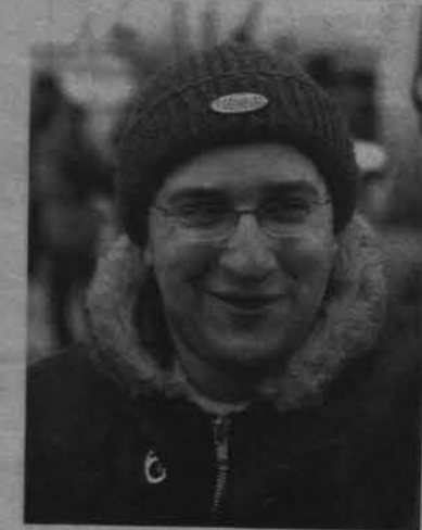
Режиссер-постановщик Александр Котт.

съемка эпизодов, которые займут в фильме всего несколько секунд. Кинематографисты использовали в кадре наиболее показательные детали полуразрушенного временем гидросамолета.