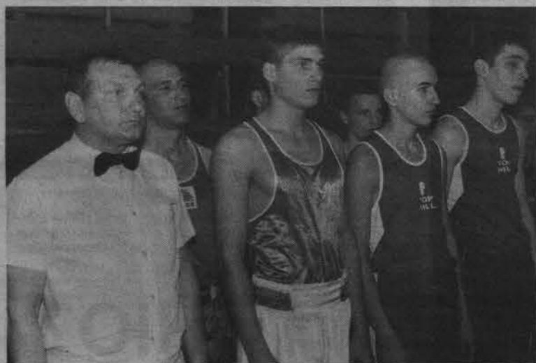
Парад участников турнира.