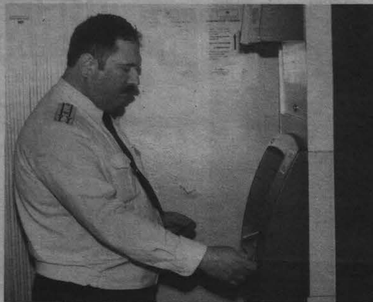
Один из первых клиентов.