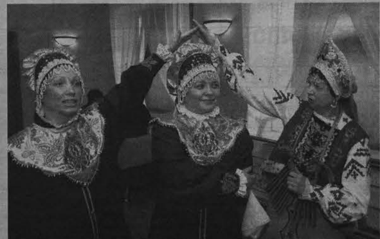
Народный ансамбль русской песни «Россия».

Первыми на сцену вышли ее хозяева - детские и взрослые коллективы ДК «Строитель». Несмотря на отсутствие собственной концертной площадки, они сумели сохранить статус (шесть коллективов подтвердили свои звания образцовых и народных) и желание работать, творить. Выступления самодельных артистов всегда с удовольствием принимают зрители Североморска и области. Теперь их работа станет еще более качественной и плодотворной.