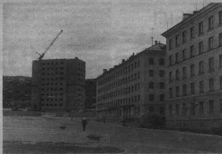
Строится третья девятиэтажка со встроенным магазином «Мебель». 1968 год.

Материал предоставлен архивным отделом администрации ЗАТО Североморск. Фото из семейных альбомов наших читателей.