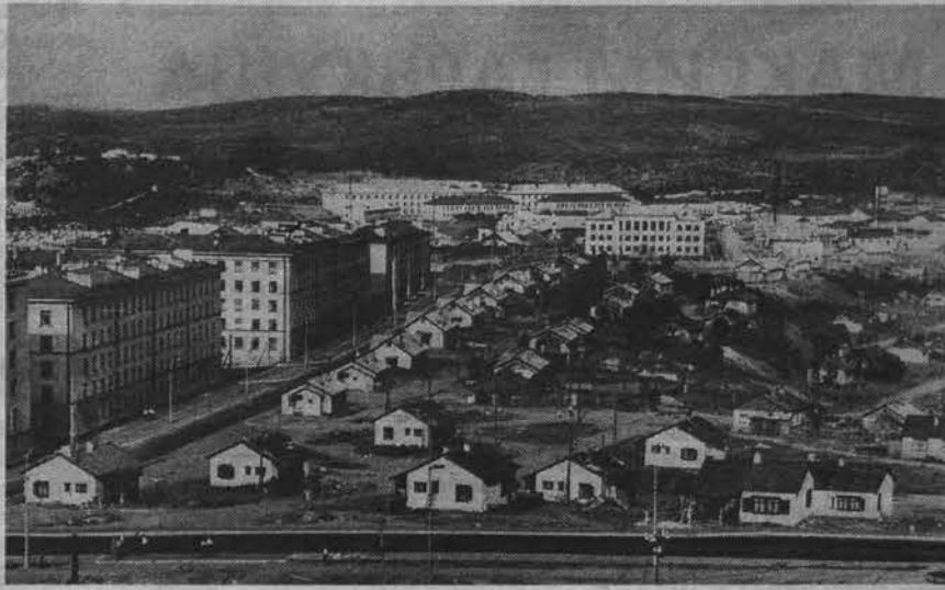
Таким был Североморск в 60-е годы.

В Ваенге зарегистрированы военторг, ОРС «Северострой», «Северострой». Поселок имеет центральный водопровод и канализацию, которые подведены только в жилые кирпичные дома Нижней Ваенги. Население берет воду из колонок. Отопление почти во всех домах центральное - водяное. Освещение в поселке электрическое, электроэнергия подается как из Мурманска, так и от базовой электростанции. Занимаемая площадь поселка составляет примерно 11 кв. километров. В поселке работает средняя школа, в которой обучается 577 учащихся, и в школе ФЗО - 400. Имеются поликлиника, родильный дом на 20 коек, амбулатория и молочная кухня. Из учреждений