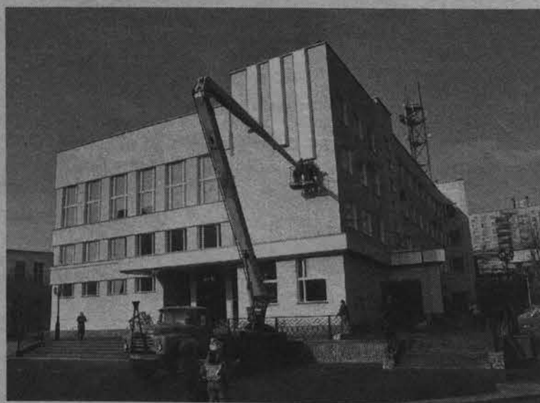
Так выглядел ДК накануне открытия. Теперь это уже история.

Генеральным подрядчиком в реконструкции выступила фирма ООО «Мурманстрой». Здесь сделана новая вентиляционная система, установлена пожарная сигнализация, заменены наружные и внутренние тепловые сети, произведены работы с использованием энергосберегаю-