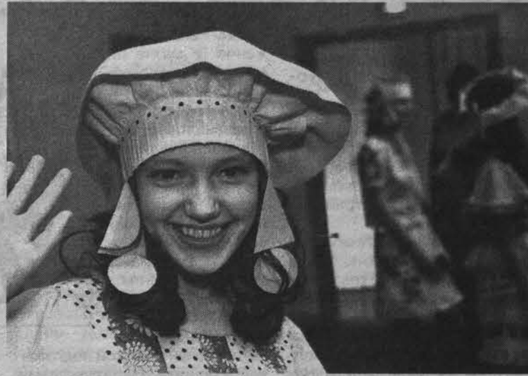
Счастливая улыбка победительницы.