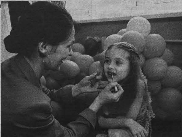
Приятные хлопоты перед выступлением.