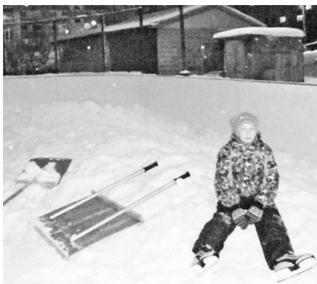
Скрепки и лопаты у жителей Сафоново-1, как тот бронепоезд: постоянно готовы к работе.

В общем, получается, что все службы несут свою вахту, преодолевают трудности и изыскивают возможности, а результат стремится к нулю. Беглый взгляд на календарь подсказывает, что новым кортом сафоновцы смогли в полной мере воспользоваться только в новогодние каникулы.