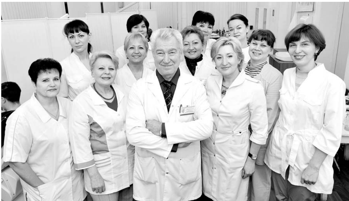
Несмотря ни на какие трудности, коллектив стоматологического отделения всегда встречает пациентов улыбкой.