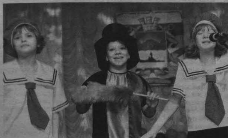
Обладатели гран-при поют о веселом трубочисте.