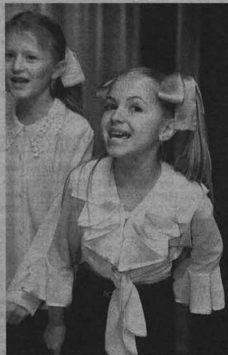
Настоящие артисты из СШ №9.