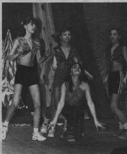
Мисс-оригинальность со своей командой.