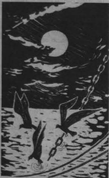
«Чайки за кормой». Графика.