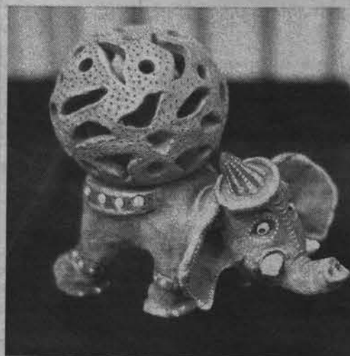
Коллективная работа учащихся североморской ДХШ. Фрагмент из серии «Цирк». Керамика.

Но рисунки это не единственное, что можно увидеть на выставке. Здесь представлены и коллективные работы. Это керамические скульптуры знаков зодиака и задорных гномиков, бумажные макеты «Шляпа», поражающие своей оригинальностью.