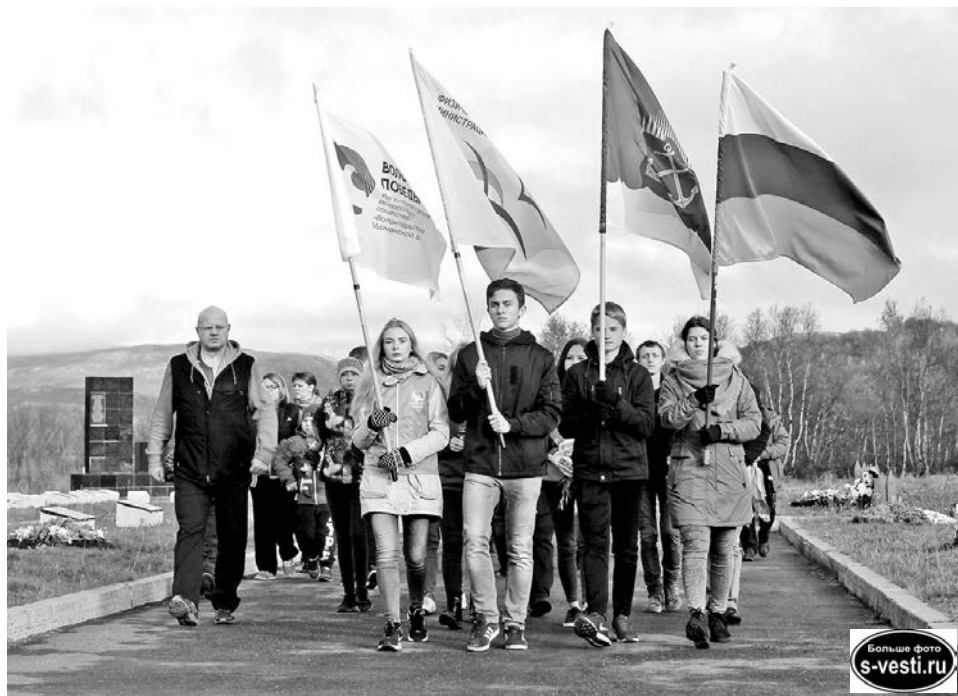
Долина Славы - неизменный пункт маршрута североморцев.

Елена ЗАХАРОВА.