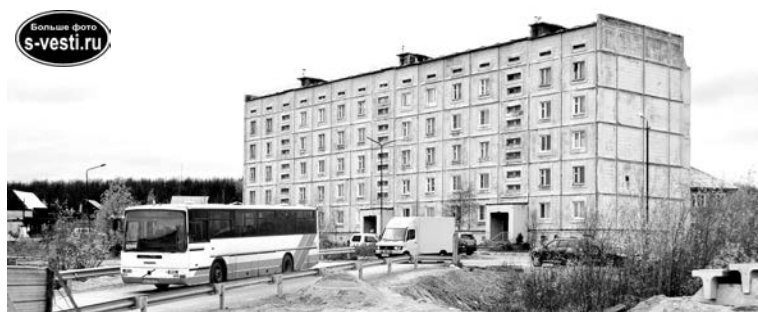
Весь транспорт до весны 2018г. будет ходить по территории дома №15 по ул.Гер.Североморцев.