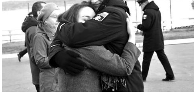
После долгой разлуки такое счастье схватить в охапку самого дорогого человека!