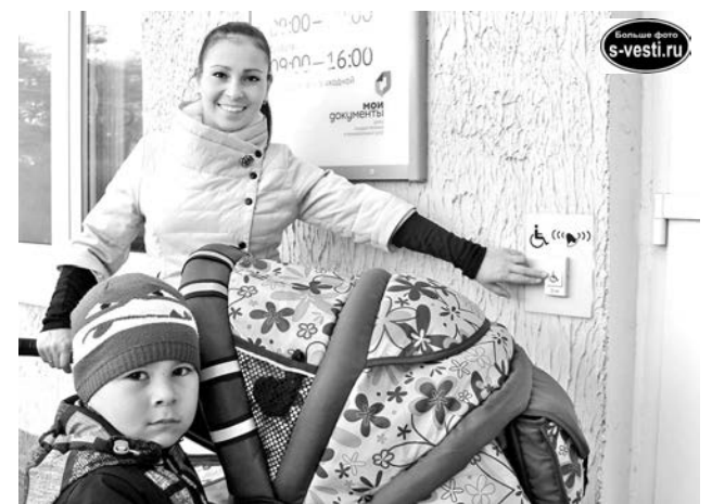
Кнопка вызова дежурного на входе в МФЦ.