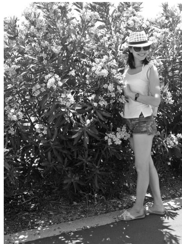
Среди садовых кустарников олеандр считается самым ядовитым, но об этом автор узнала уже после фотографирования.

преданию, жил Минотавр. Исследователи нашли в пещере наконецники стрел и глиняную посуду. Кто знает, а вдруг история о человеке с головой быка не такой уж и миф?