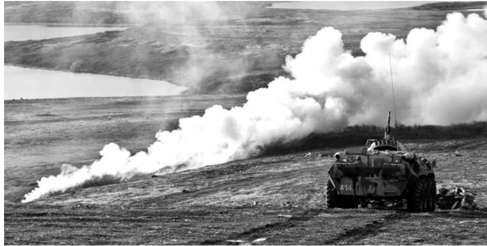
Учебный бой на полигоне Пумманки проходил динамично, заставив экипажи бронетранспортеров действовать на опережение.

Оборону морского побережья вели «черные береты» отдельной Киркенес-