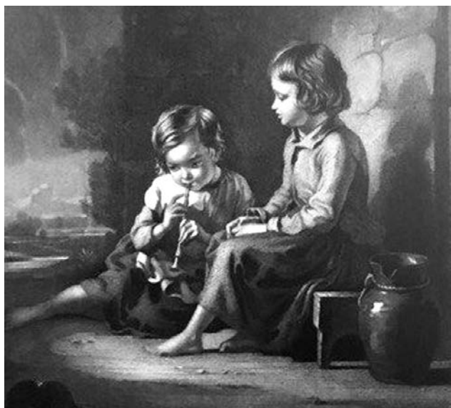
«Детская хижина», Эдвард Уильям Бартон-Райт (гравюра резцом).