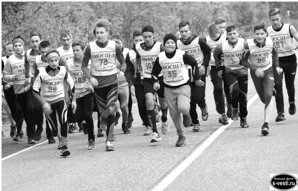
Дан старт дистанции на 7,5 км - мальчишки присоединяются к марафонцам.

В минувшее воскресенье прошел традиционный легкоатлетический пробег «Осенний кросс», который собрал почти сотню спортсменов.