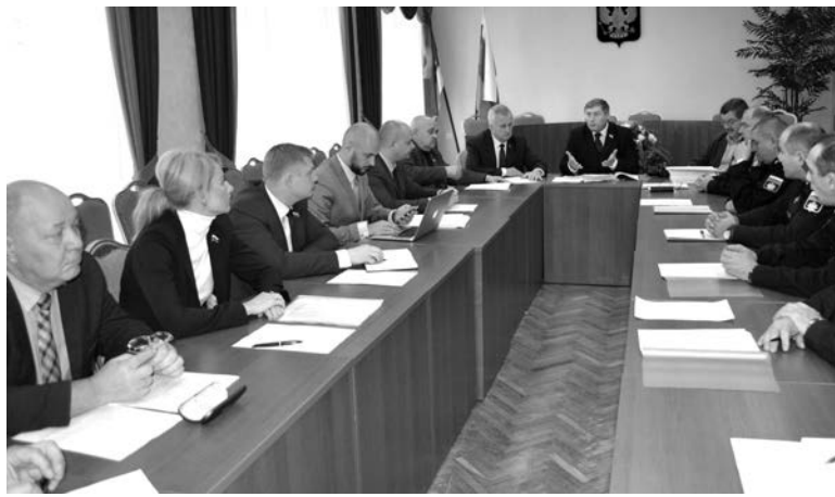
Работа комиссии носила судьбоносный характер для нашего ЗАТО.

Решением конкурсной комиссии кандидатами на должность