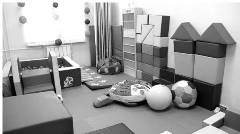
Сенсорная комната - гордость отделения реабилитации детей и подростков с ограниченными возможностями здоровья североморского КЦСОН.