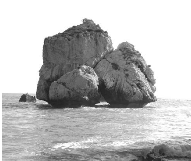
Вода у камня Афродиты из-за особенностей морского течения достаточно холодная, волны высокие, поэтому необходимо соблюдать осторожность во время купания.