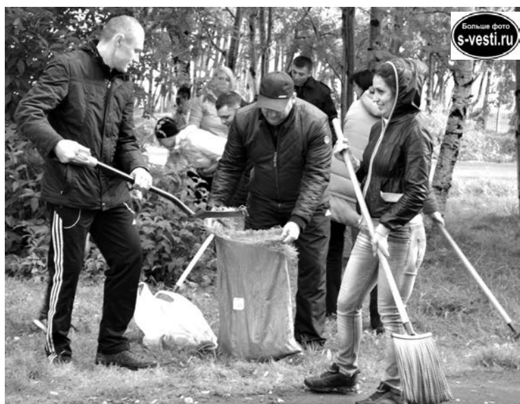
За участок ул. Советской, в районе домов 14 и 16, можно не беспокоиться - здесь всегда чисто.

16 сентября около полусотни военнослужащих и гражданского персонала подразделения 84-го межвидового учебного центра им. маршала артиллерии Е.В.Бойчука и слушателей подразделения приняли участие в уборке территории на ул. Советской. Два небольших сквера, пар-