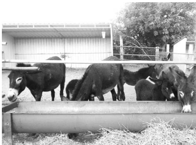
Осел - один из символов Кипра. Познакомиться с парнокопытными можно на ослиных фермах.

Накупавшись и вдоволь нафотографировавшись, мы отправились в ущелье Авакас. Это заповедное место мне очень понравилось. Не омрачили настроение ни палящая жара, ни большое расстояние, которое пришлось преодолеть пешком. По дороге в ущелье мы увидели несколько горных козлов, которые на большой высоте прыгали по выступам в скале. Вместе с остальными путниками мы карабкались по камням и пробирались через поваленные деревья. В некоторых местах скалы нависали прямо над головой, и казалось, что вот-вот рухнут. Многих заинтересовал лабиринт Минотавра - одно из таинственных мест ущелья. Как рассказала гид, пройти в пещеру без специального альпинистского снаряжения невозможно - вниз ведет узкий лаз и зигзагообразный тоннель. Там, на глубине 70 метров, по