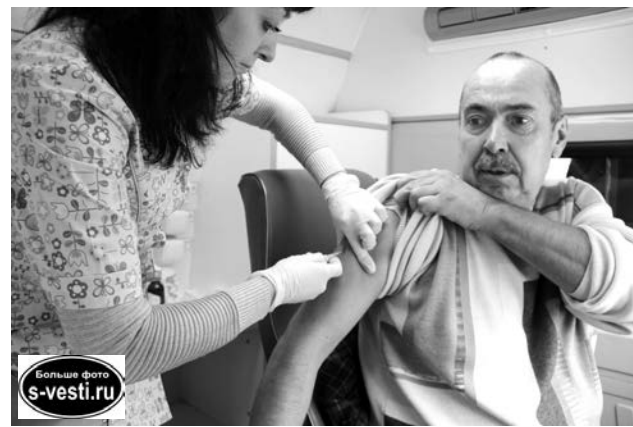
Каждое воскресенье с 11.00 до 16.00 на площади Сафонова можно получить бесплатную прививку от гриппа.