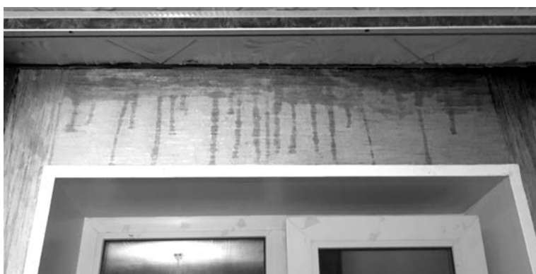
Даже если на следующий день после потопа обои высохнут, в перекрытиях вода все равно останется.

ся пробраться к вам в квартиру? Первое и самое важное - набраться терпения и все же дозвониться в аварийную службу по тел. 05 (с моб. 8(81537) 05111). Помните, проблема могла возникнуть не только у вас, поэтому звонков будет много. Прибыв на место происшествия, работники аварийной службы осмотрят его и зафиксируют факт заливания.