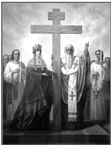
Икона праздника Крестовоздвижения.