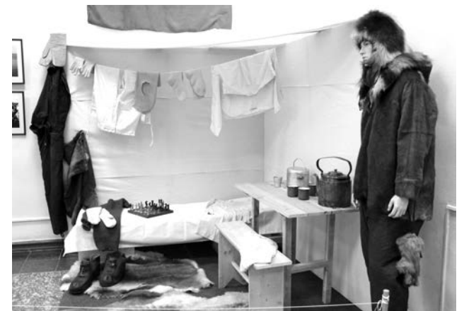
В таких скромных условиях жили папанинцы.