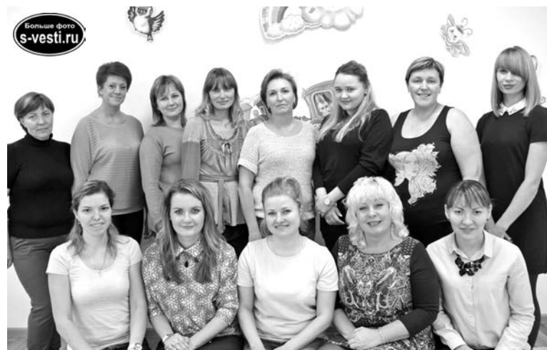
Сотрудники детского сада работают в две смены. На вечернюю вахту заступила вторая часть педагогического коллектива.

Коллектив д/с 15 поздравляет с днем дошкольного работника заместителя заведующего по АХЧ