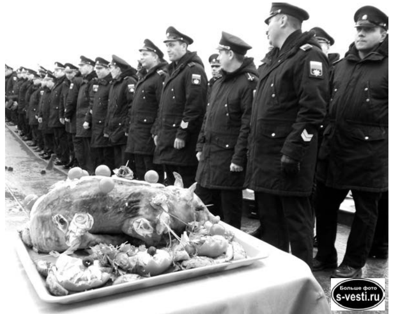
Вернувшихся из Арктики моряков ждал теплый прием с традиционным жареным поросенком.

Быстро завершившийся митинг ускорил трогательные мгновения встречи военнослужащих с родными и близкими. Значительная часть экипажа, кроме дежурной