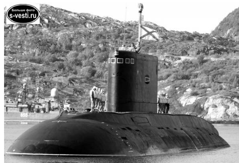
На борту дизельной подводной лодки «Владикавказ» в течение четырех месяцев выполнял задачи экипаж однотипной лодки «Калуга», для которого это был третий дальний поход в нынешнем составе.

- От имени командующего Северным флотом благодарю вас за выполнение поставленных задач. Это был самый напряженный, длительный и ответственный поход, совершенный за последние годы дизельной подводной лодкой. Высокое качество выполнения за-