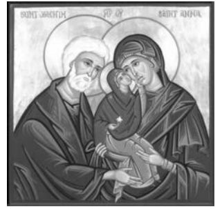
Святые Иоаким и Анна с младенцем Марией.

Издrevле Пресвятая Богородица считается защитницей и покровительницей земли Русской. Неслучайно именно день Ее Рождества является Днем зарождения российской государственности и Днем воинской славы России. 21 сентября 1380 года в Куликовской битве была одержана одна из самых значимых побед русского народа, положившая начало освобождению от татаро-монгольского ига. Именно у Божьей Матери перед началом битвы просил помощи святой благоверный князь Дмитрий Донской, ей молился преподобный Сергий Радонежский, благословивший двух иноков Троице-Сергиевой лавры: Пересвета и Ослябю – на участие в битве.