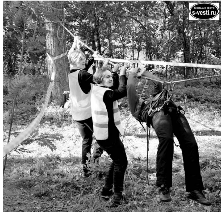
«У тебя все получится!» - волонтеры помогают паралимпийцу преодолеть на обвязках канатную дорогу.