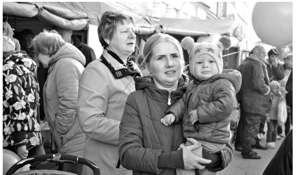
На праздник пришли целыми семьями.