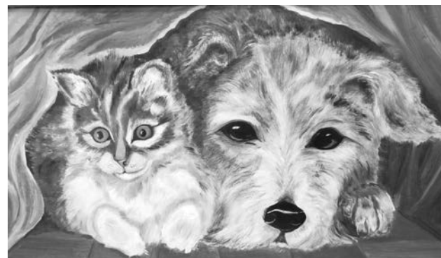
«Верные друзья» (живопись, масло) учащейся Т.Сметаниной.

нено искусство наших мастериц. Подробности о «Школе ремесел» можно узнать по телефонам: 5-