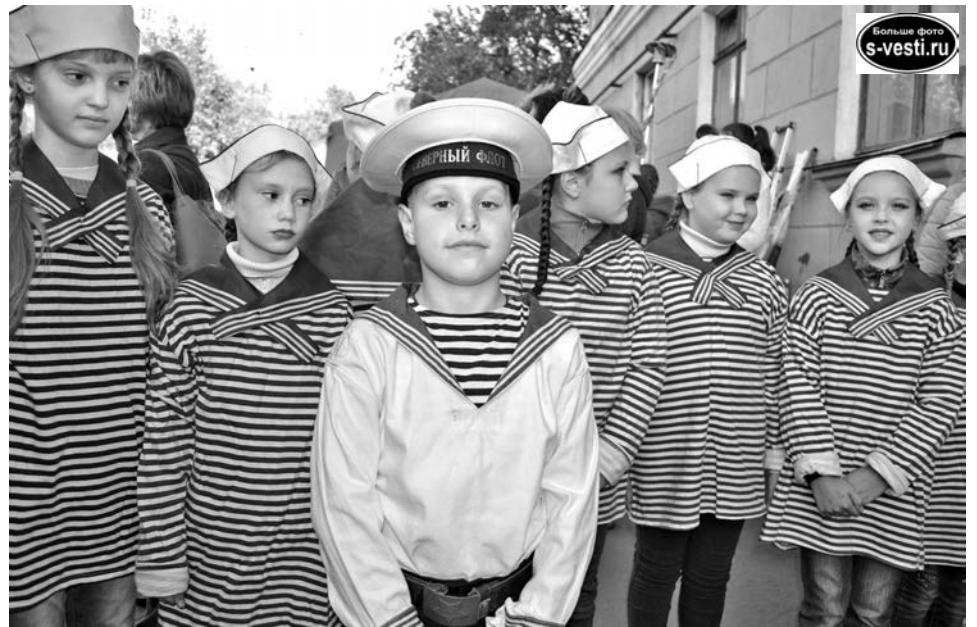
Младшая группа клуба эстрадного танца «На Пять».