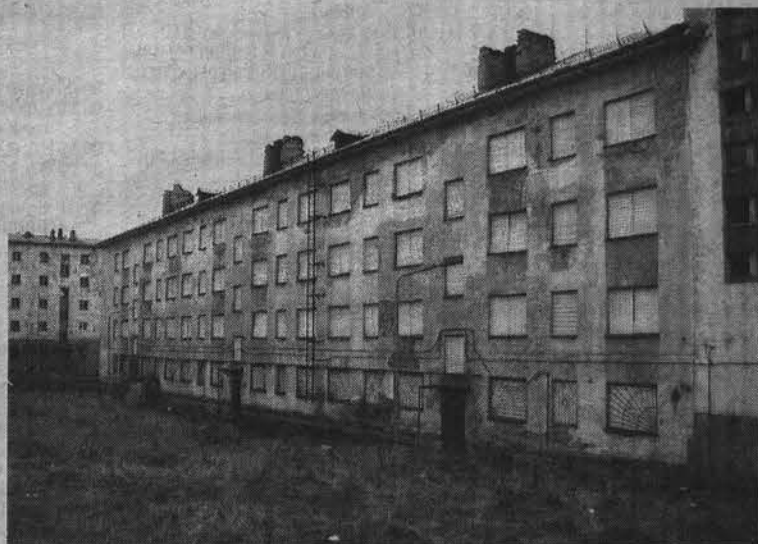
Бывшее офицерское общежитие на Комсомольской, 7.