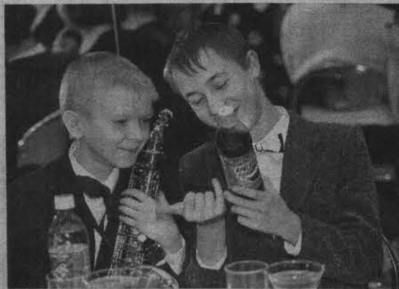
Угощение ребятам пришлось по вкусу.