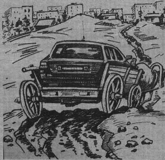
Иллюстрация И.Ворона к книге М.Зверева.

че, названной «Нет, я не просто книгу издаю, я открываю вам судьбу свою», авторы не только рассказывали о своих творениях, они