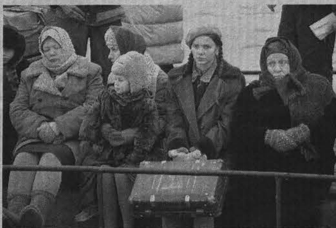
Сцена из фильма. Третья слева - Лиза Боярская.