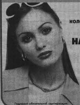
Подлинит обязательной сертификации.

Лиц. Г-734871 выд. Комитетом по торговле адм. Мурманской обл.