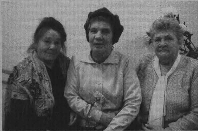
Теплый прием в ДК «Строитель» пришелся по вкусу всем.

Ирина КУЗЬМИНА. Наталья СТОЛЯРОВА. Анастасия МАНУШКИНА.