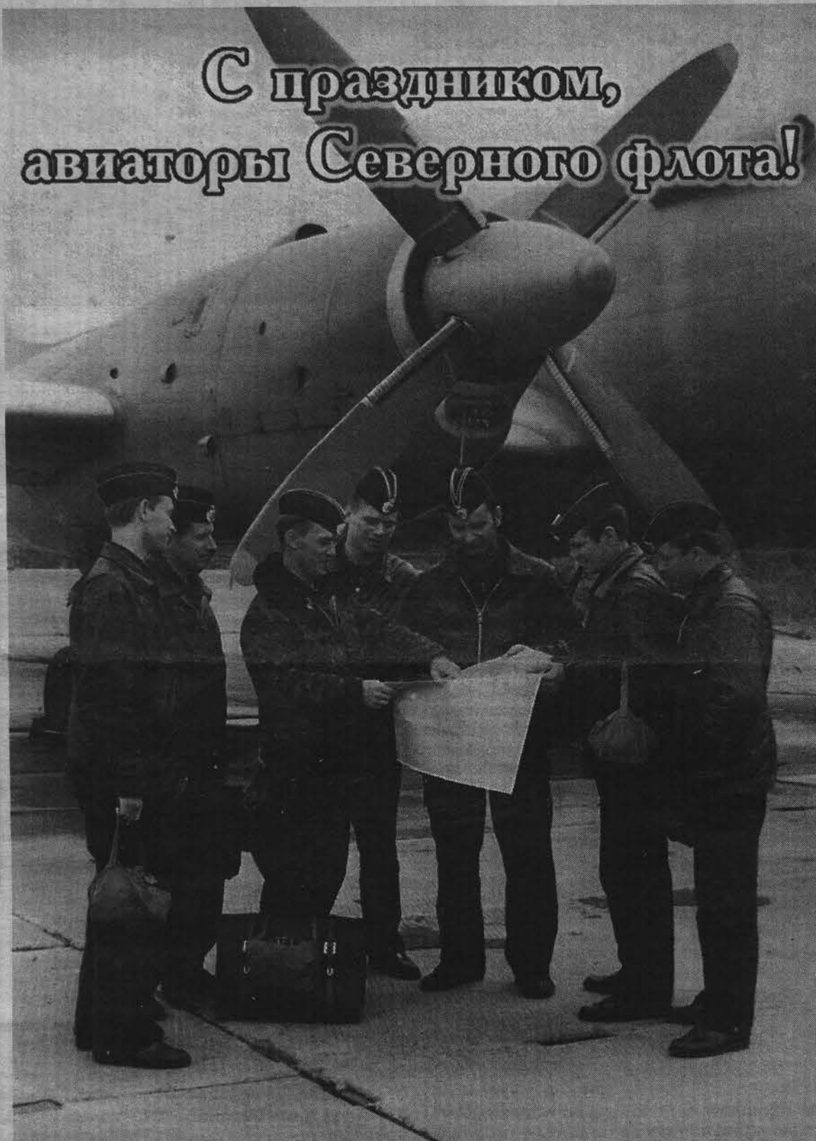
Материал к Дню авиации ВМФ читайте на 5 стр.