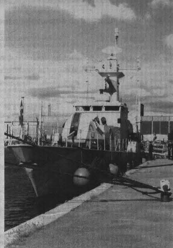
Корвет «Мальме». Длина 50 м, водоизмещение 380 т, скорость более 30 узлов. Год выпуска - 1985.

Интересных посещений было немало: технический институт, детский сад, школа и дом престарелых, министерство иностранных дел, институт внешней политики, радио, телевидение, газеты и многое-многое другое. Только для перечисления всего увиденного потребовалась бы не одна страница. А уж рассказывать