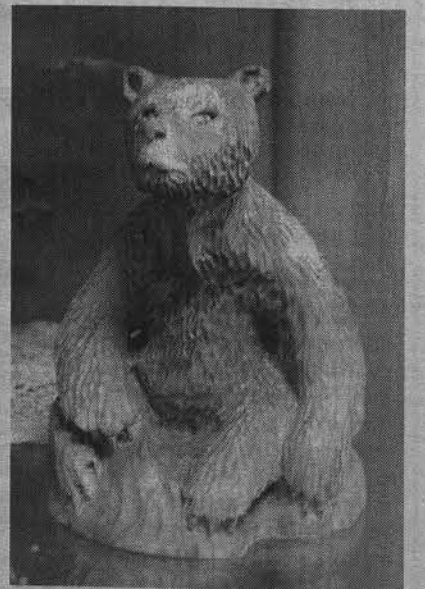
«Медведь» Дмитрия Губенко.