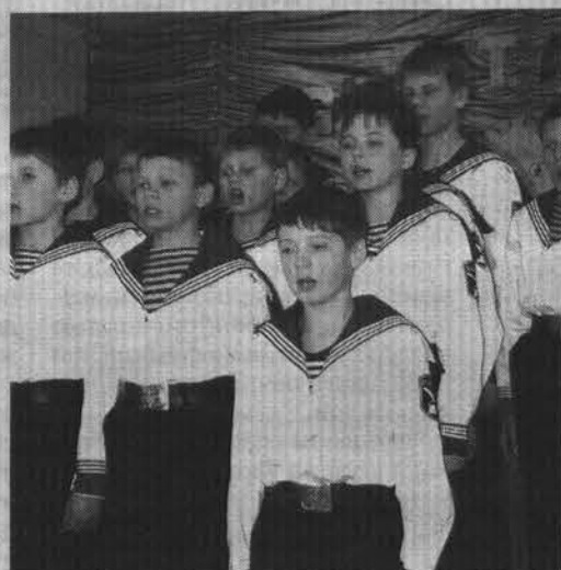
Эти brave кадеты не по годам серьезны.