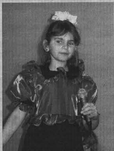
Юная звезда эстрады Галя Руликовская.

29 мая в школе-интернате прошел традиционный праздник «Счастливый детства миг», посвященный Международному дню защиты детей. Сегодня здесь воспитываются 120 мальчишек и девчонок. Это дети с трудной судьбой, но они так же, как и вся детвора, мечтают о море веселья и горах сладостей. В этот день некоторые их желания исполнились.