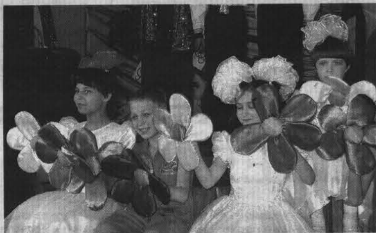
Веселье в полном разгаре.

В этот день ребята на некоторое время попали в «Королевство аттракционов». Здесь они могли проявить талант, ум, силу, ловкость и испытать удачу. За участие в каждом конкурсе им вручали призы. Новшеством в этом году стало кафе, где