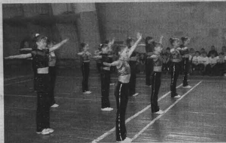
Девочки из секции фитнеса и аэробики ДЮКФП-2 показали собравшимся, что путем постоянных физических упражнений можно не только значительно развить свое тело, но и укрепить здоровье.