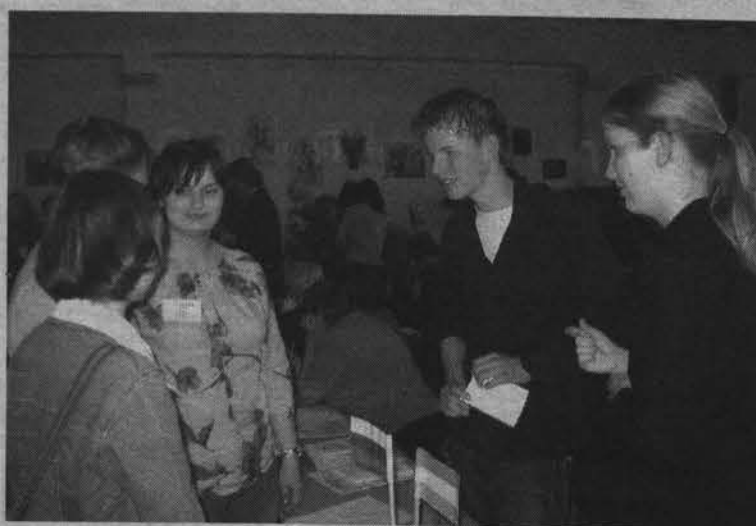
У гимназистов, наших и голландских, возможностей для неформального общения было более чем достаточно.

Помимо передачи транспортных средств в договоре предусматривается еще два немаловажных момента: в течение трех лет наши партнеры за свой счет будут поставлять необходимые для ремонта запчасти, а десять самых лучших водителей и механиков АТП бесплатно пройдут обучение в Будене на иностранных авто-