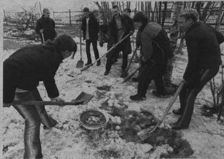
Не увильвали от субботника и учащиеся СШ №1.

Вообще такое хамское отношение североморцев к своим улицам, домам уже и злости у работников РСЭУ не вызывает, только обиду и отчаяние. Сизова, 11, 1-й подъезд. Ежедневно по утрам здесь жители оставляют аккуратно упакованные мешки с мусором. А дворник,