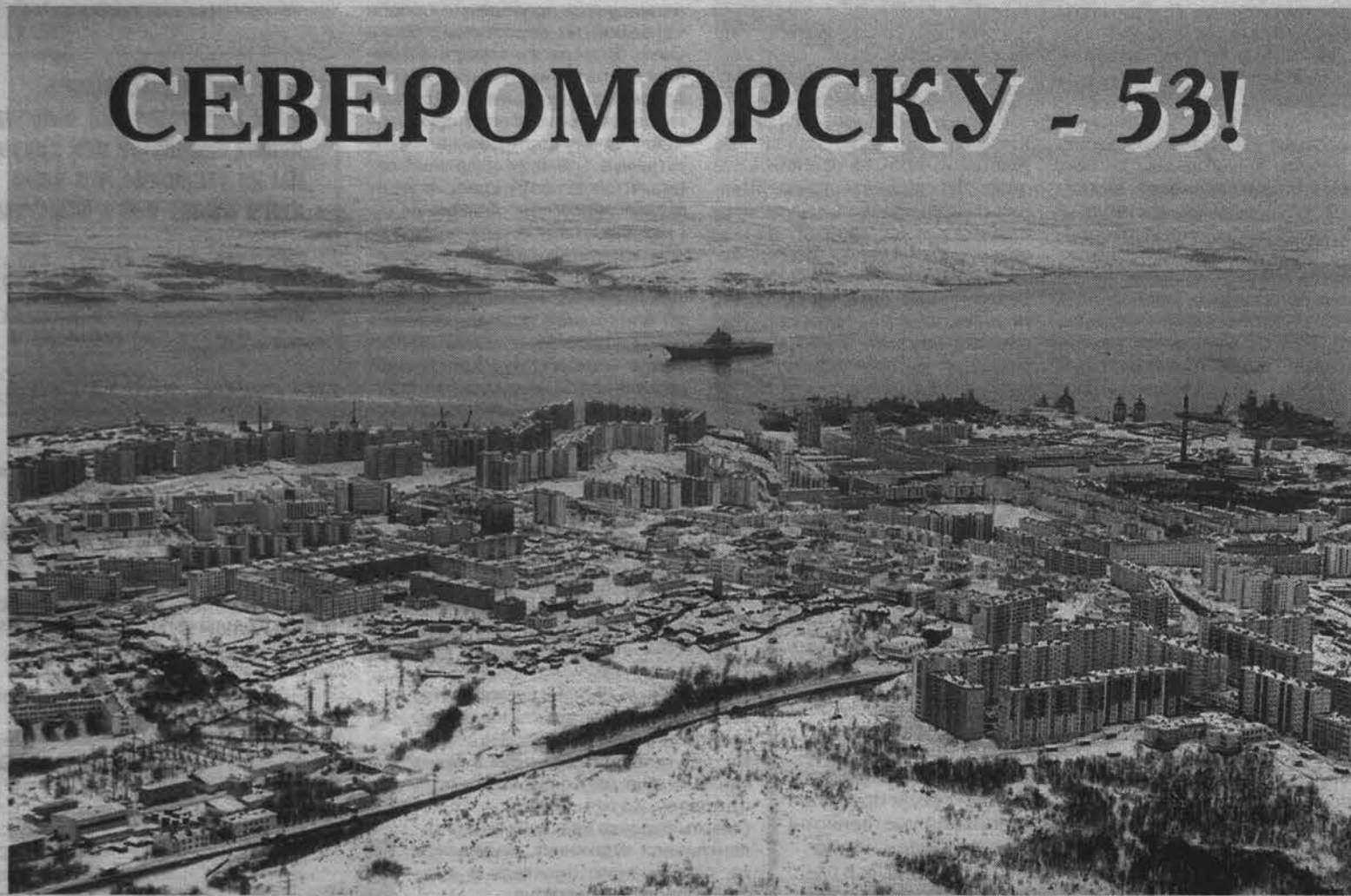
Материал ко Дню города читайте на 4 стр.