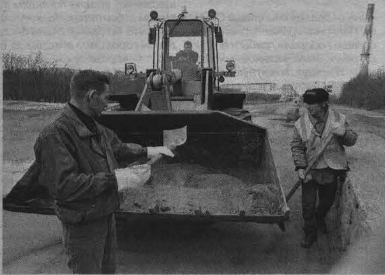
Служба «Автодорсервис» работала в обычном режиме.