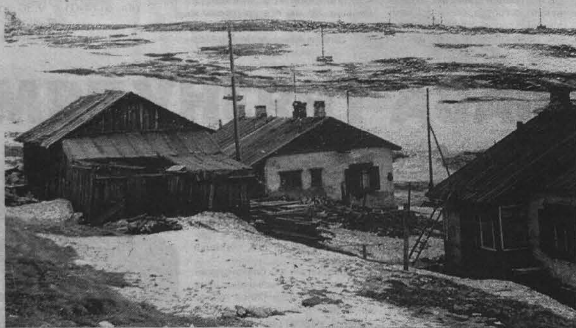
Конец 40-х - начало 50-х годов. Улица Строительная (теперь Падорина).

Александр ПАНИЮШКИН.