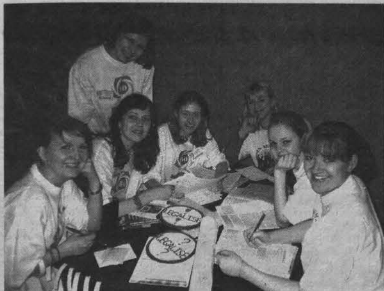
И серьезную проблему можно решать весело.