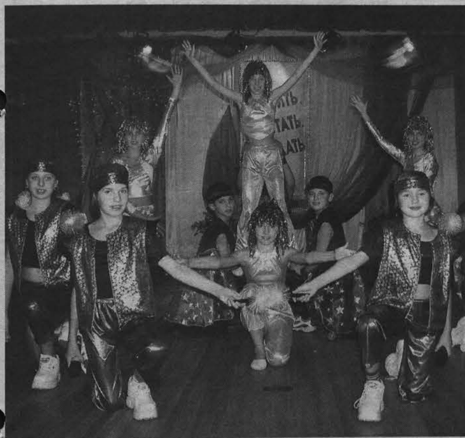
«Космос». Средняя группа.