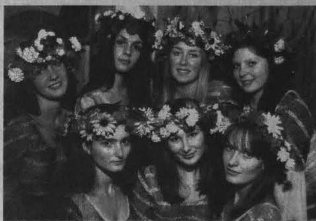
«Венок». Старшая группа.