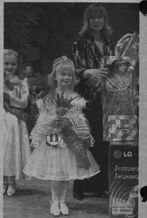
Вот она главная маленькая мисс Североморска!

«...Но даже если ты не станешь мини-мисс,