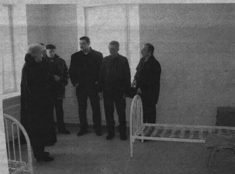
Последний обход перед открытием детского отделения ЦРБ.

Управление социальной защиты населения администрации ЗАТО Североморск приглашает срочно пройти регистрацию: