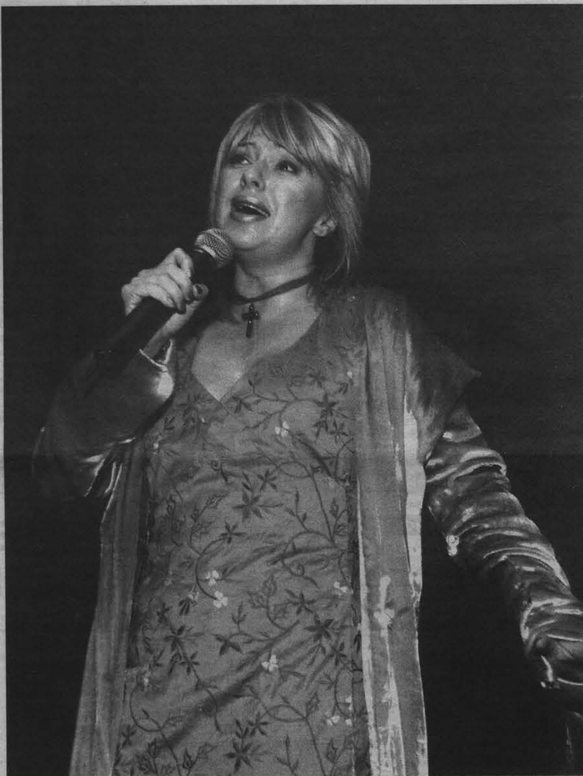
Североморцев с Днём защитника Отечества поздравили столичные артисты Алёна Апина и Святослав Ещенко. Концерт прошёл 21 февраля в ДК «Строитель».