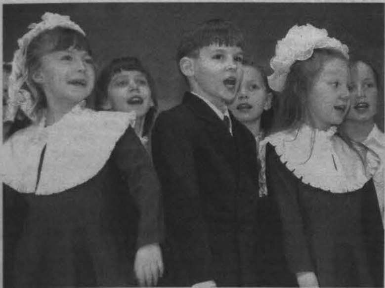
Младший хор хорового отделения.

Сегодняшняя школа - это большой преподавательский коллектив - 77 профессионалов, мастеров своего дела, энтузиас-