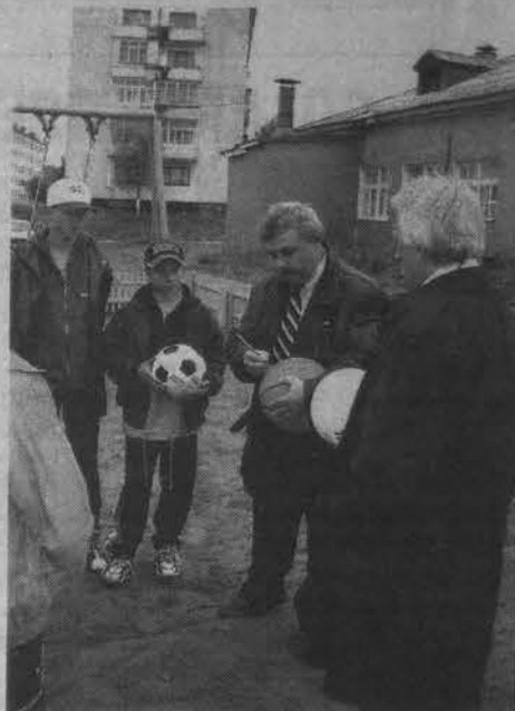
Автограф на память юным футболистам. 2000г.