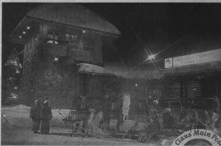
Почтовое отделение Санта-Клауса.

Конечно же, мы были заняты не только вопросами мирового характера. В программе семинара было предусмотрено посещение музея Арктики, резиденции Санта-Клауса, которая находится в нескольких километрах от Рованиеме. Это большой деревянный дом, который стоит в