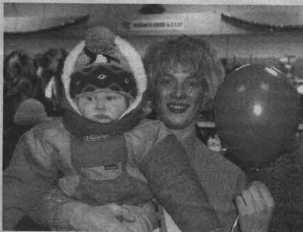
Первых покупателей-малышей встречал сам Карлсон.

Детворе в магазине раздолье: можно оставить родителей и поучаствовать в конкурсе рисунков возле мольберта или