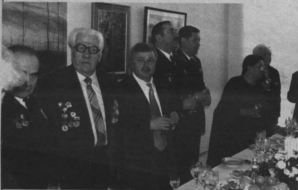
На встрече с ветеранами. Май 2000 года.

- Конкретных предложений из столичных кабинетов не было. Но я и не делал никаких шагов к этому. При желании создать там условия для приглашения можно без проблем. У меня же к этому просто нет интереса. Изначально понял, что слишком честолюбив. Там бегать по коридорам, бумажки носить, когда здесь я полноправный руководитель. Баллотироваться на должность мэра Мурманска отказался принципиально по двум при-