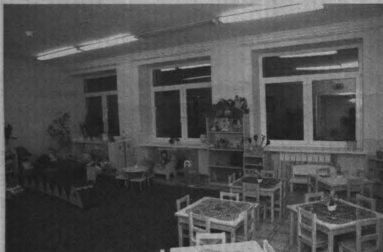
Так выглядит обновленная группа.

Уважаемого директора компании ООО «Медведь»