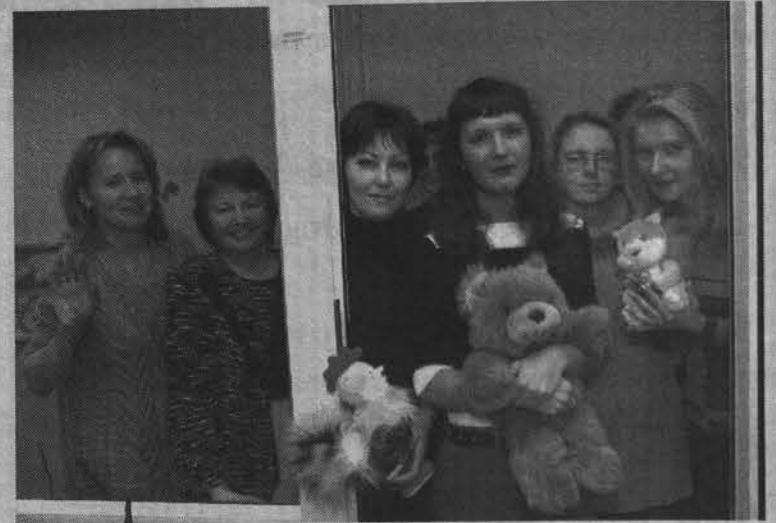
Дружный коллектив детского сада.