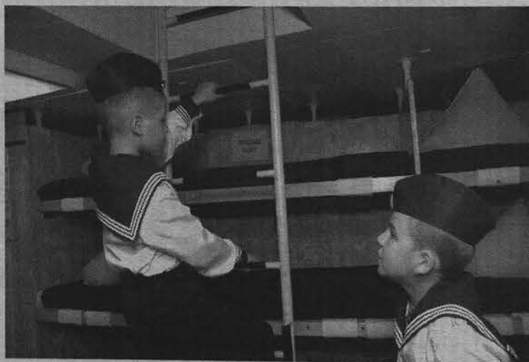
Аскетичность матросского быта не пугает юных кадетов.