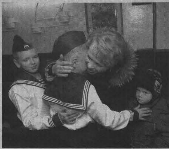
Не грустите, родные.