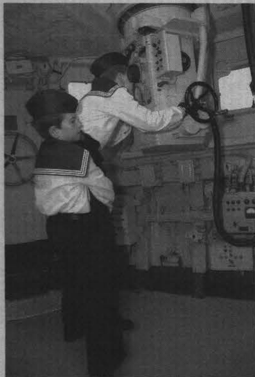
Побывать на главном командном пункте - мечта любого мальчишки.