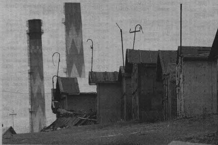
В темное время суток проникнуть в подобное строение не составляет труда. Какое из них следующее на очереди?

Александр ПАНЮШКИН.