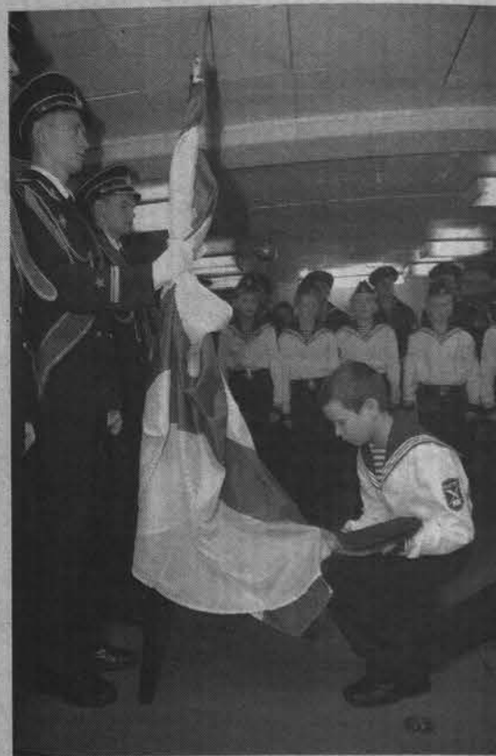
Один из самых торжественных моментов присяги.