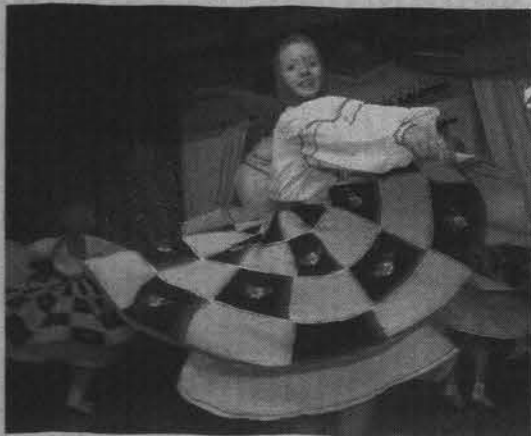
Своим искусством «Мастерок» всегда создает радостное настроение.