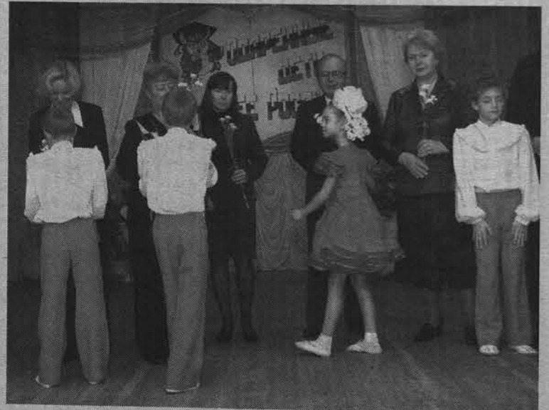
Дорогим наставникам - цветы и поздравления.