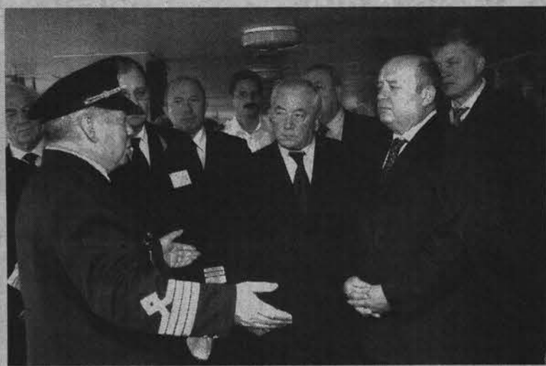
Председатель Правительства РФ Михаил Фрадков на борту атомного ледокола «Советский Союз».