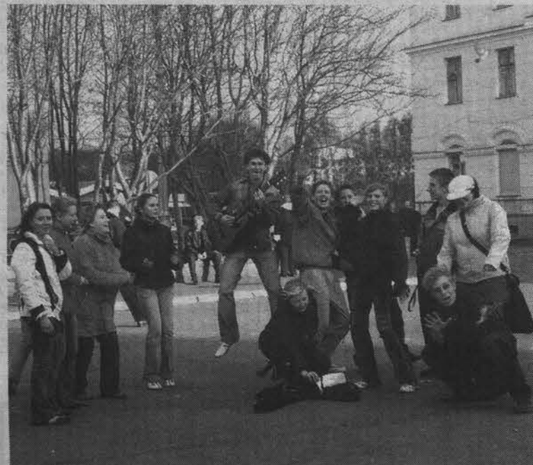
Ни много ни мало, а на печенье к чаю заработали.

Наталья СТОЛЯРОВА.