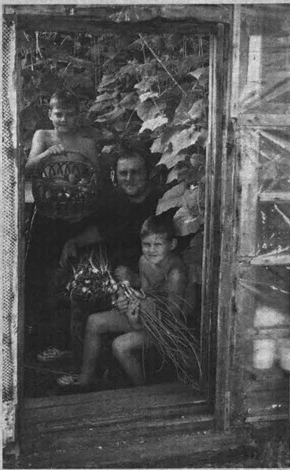
Любят отдыхать на северной даче и дети, и внуки.

Наталья ПЕТРОВСКАЯ.