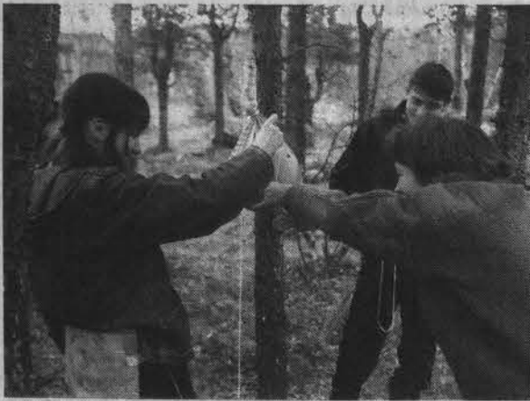
Умывальник из спасательного мешка.

Программа нынешнего слета включила в себя пеший переход от озера До-