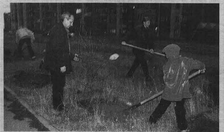
На посадке - и стар, и млад.