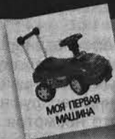
МОЯ ПЕРВАЯ МАШИНА