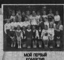
МОЙ ПЕРВЫЙ КОЛЛЕКТИВ