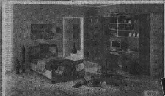
Мой первый кабинет

Мебель в кредит без первого взноса на 15 месяцев компьютерные столы от 1800 руб. стеллажи от 1300 руб. стенки от 8500 руб. стулья от 500 руб. кровати от 2700 руб.