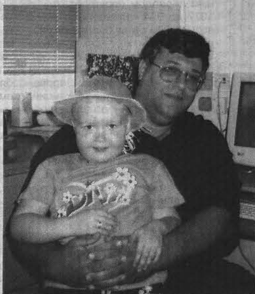
Доктор Саярд, вернувший Катюше жизнь.

Наталья ПЕТРОВСКАЯ.