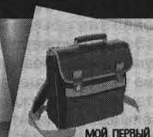
МОЙ ПЕРВЫЙ ДИПЛОМАТ