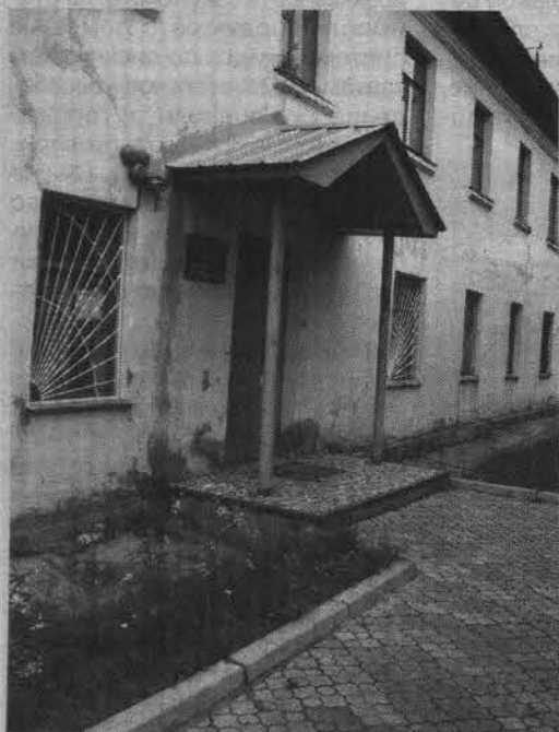
Незречное крылечко, зато внутри тепло и уютно.

Наталья ПЕТРОВСКАЯ. Фото автора и из архива библиотеки.