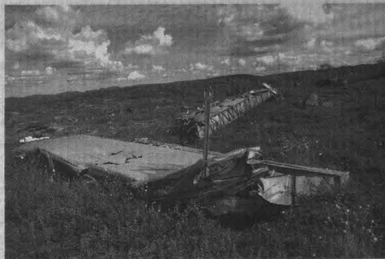
Части подбитого бомбардировщика разбросаны далеко друг от друга.

До карьера нас благополучно довели, а далее до места пришлось идти пешком. Местность не просто пересеченная, а сплошные подьемы да крутые спуски, ручьи со скользкими камнями, так и норовящими прищемить ногу или еще какое-нибудь увечье нанести. Дошли до реки Тювы. Перейти можно и вброд,