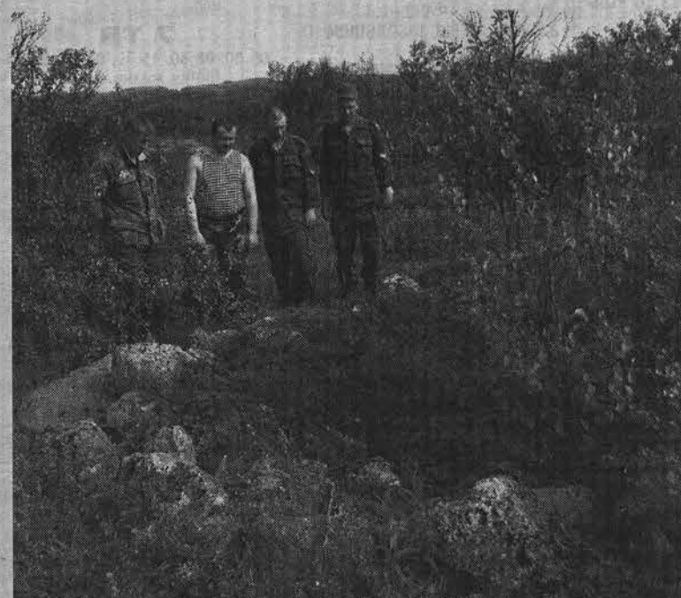
Братская могила экипажа окружена камнями.