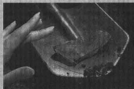
Раскаленные осколки после взрыва.