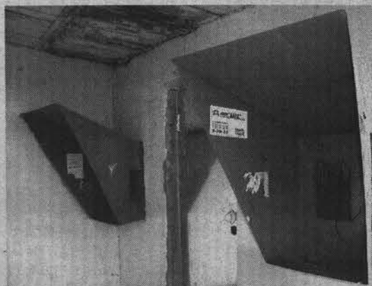
Автобусная остановка на Комсомольской.

В общей сложности в разных частях города самым загадочным образом испарилось около пяти телефонов-автоматов: Сивко, дома 2 и 7, Кирова, 2, Саши Ковалева, 4. А на