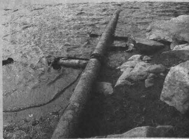
Эта ржавая достопримечательность пребывает в нерабочем состоянии.

- Как объяснил командир местной в/ч, одно время в гарнизоне Мохнаткина Пахта испытывали дефицит воды, поэтому и пустили трубу, через которую вода самотеком, без насосов, поступала в питьевое озеро. Сейчас потребность в этом отпала, потому что жителей в гарнизоне стало меньше и, соответственно, уменьшился объем потребляемой воды. Через трубу она уже не поступает. А обмеление - явление природное, естественное. Дно у озера песчаное, большого