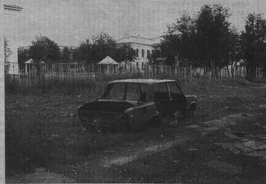
Этот остов, наверное, тоже чья-то собственность.