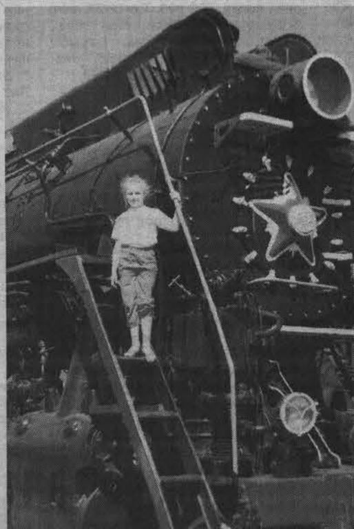
Лазать по экспонатам запрещено, но очень хочется.

Встраиваемая техника – это вовсе не новомодное изобретение современной дизайнерской мысли, а «дела давно минувших дней». Вот тумба-граммофон, по виду неотличимая от других предметов домашней обстановки. Поднимаешь крышку – ставишь пластинку, открываешь среднюю дверцу – видишь трубу, нижнюю – шкафчик для хранения пластинок. Компактно и стильно!