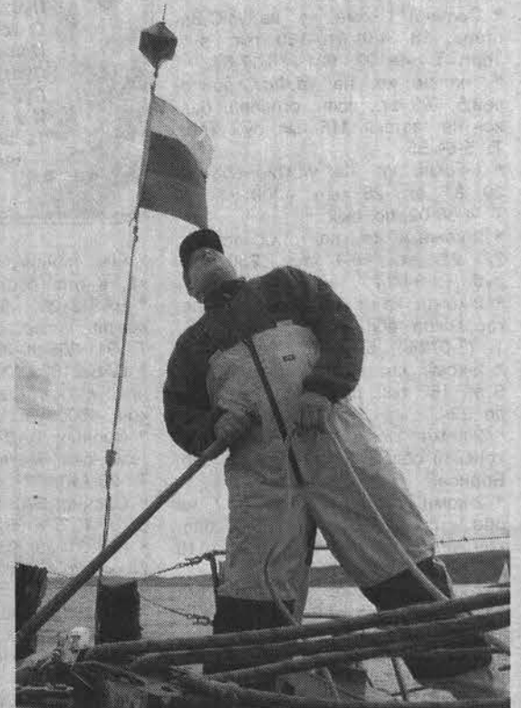
На всех парусах - к победе!

Первое место в первой группе занял экипаж «Легенды» из Северодвинска, на втором месте – североморская «Вега». Чемпионами во второй группе стали североморцы на «Либерти», вторыми пришли мурманчане на «Кайре», третьими опять были наши на «Сан-