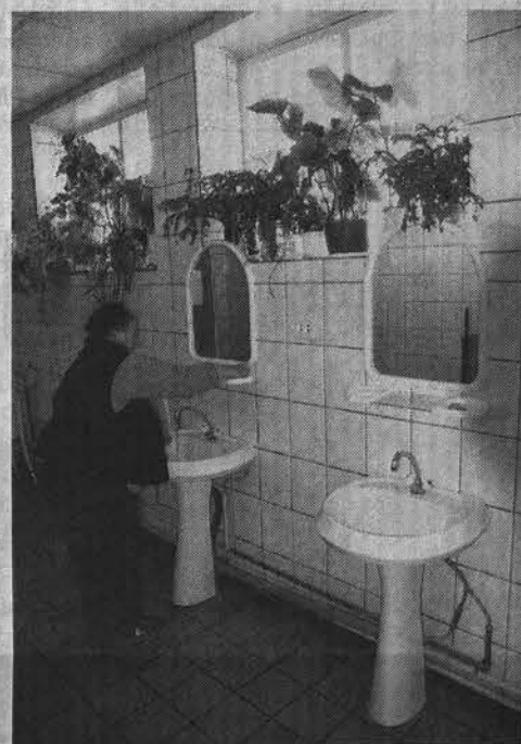
Здесь всегда чисто.