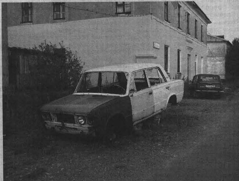
Разукомплектованная легковушка на ул. Северной.

Оказывается, прежде чем эвакуировать автомобиль, предстоит сложная процедура признания его бесхозным. А это не так просто, как кажется на первый взгляд. У каждого такого «мертвого» автомобиля есть свой владелец. Поэтому специалисты отдела по охране окружающей среды совместно с сотрудниками ГИБДД, обнаружив разукомплектованное транспортное средство, ведут кропотливую работу по установлению его владельца. Кстати, в соответствии с приказом МВД выявлять брошенный транспорт и штрафовать владельцев должны и участковые, которые не торопятся осуществлять эти полномочия. И лишь