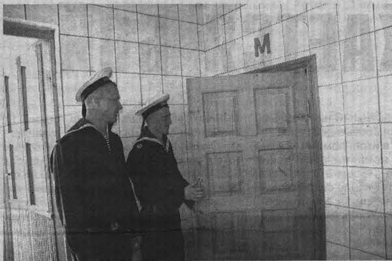
Общественный туалет в Североморске бесплатный.