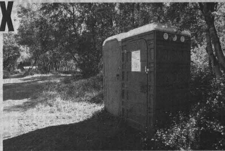
А вот за услуги биотуалета придется платить.

Ежедневно туалет функционирует до 22 - 23 часов (летом до 21), во время народных гуляний – до двух часов ночи. Однако многие, особенно мужчины в пьяном уме и нетрезвой памяти, не затрудняют себя походом в это заведение, а облегчаются