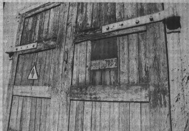
Не влезай - уьёт! Через трансформаторные подстанции электричество поступает в наши дома.