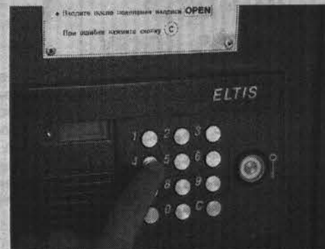
Домофон — это тоже защита от воров.

Стоимость страховки напрямую зависит от суммы, которую вы рассчитываете получить в случае потери квартиры или имущества. В основном эта цифра привязана к 1% от их реальной цены. Значительно снизит стоимость страхового полиса наличие в квартире пожарной сигнализации с выводом на пульт, решетки на окнах, металлической двери. Учитывается и то, в каком доме и каком районе расположена ваша кварти-