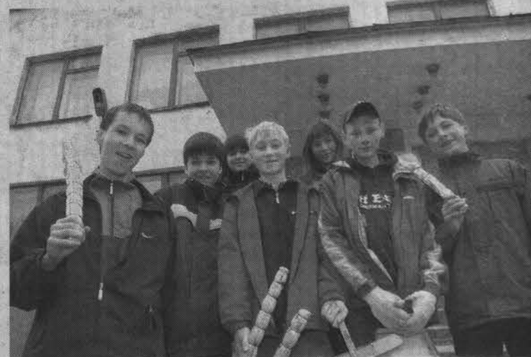
Труженики школы №9.

вообще проходит трудовая вахта, я поинтересовалась у них самих.