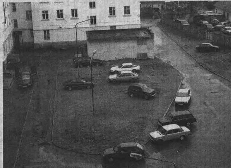
Малоприметный, но все-таки существующий газон во дворе домов №24 и 26 на ул. Сафонова стал местом «выпаса» железных коней.

Наталья СТОЛЯРОВА.